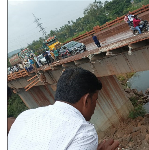
ಕೊಪ್ಪಳ: ತುಂಗಭದ್ರಾ ಜಲಾಶಯ ಮುಂಭಾಗದ ಹೊಸಪೇಟೆ ಮುನಿರಾಬಾದ್ ನಡುವಿನ ನದಿಗೆ ನಿರ್ಮಿಸಲಾದ ಸೇತುವೆ ಮೇಲ್ಭಾಗದಲ್ಲಿ ಚಲಿಸುತ್ತಿದ್ದ ಮೈನ್ ಲಾರಿ ಸೇತುವೆಯ ತಡೆಗೋಡೆಗೆ ಡಿಕ್ಕಿ ಹೊಡೆದು ನದಿಗೆ ಉರುಳಿದೆ. ನದಿಗೆ ಬಿದ್ದು ಸ್ಥಳದಲ್ಲಿ ಬಹು ಮೂಲಕ ಲಾರಿ ಚಾಲಕ ಸಾವನ್ನಪ್ಪಿದ್ದಾನೆ. ಸ್ಥಳಕ್ಕೆ ಮುನಿರಾಬಾದ್ ಪೊಲೀಸರು ಭೇಟಿ ನೀಡಿ ಪರಿಶೀಲಿಸಿದ್ದಾರೆ.