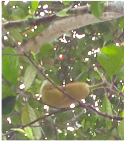
ಉದರದೊಳಗಡೆ ಹೊತ್ತ ಗರ್ಭವು ಭಾರವೆನಿಸದು ತಾಯಿಗೆ ಹೆತ್ತು ಮಡಲಿ ಇರಿಸಿ ಬೆಳಸಲು ಕಷ್ಟವೆನಿಸದು ಮಾತೆಗೆ

ಕಂದ ಬೆಳೆಯತ ನಡೆಯ ತೊಡಗಲು ಎತ್ತಲಾಗದು ಸುಲಭದಿ ಮತ್ತೆ ಕೆಲವನು ಹಿಡಿದು ನಡೆಯಲು ಜತನ ಗೈವಳು ಮೌನದಿ