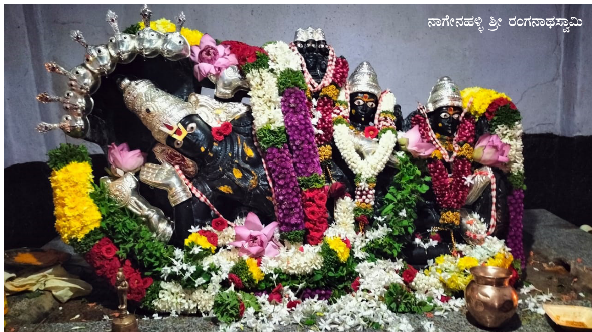
ನಾಗೇನಹಳ್ಳಿ ಶ್ರೀ ರಂಗನಾಥಸ್ವಾಮಿ

■ ಹಂಪಿ ಟೈಮ್ಸ್ ಹೊಸಪೇಟೆ ವೈಕುಂಠ ಏಕಾದಶಿ ನಿಮಿತ್ತ ನಗರದ ವಿವಿಧ ಶ್ರೀವೆಂಕಟೇಶ್ವರ ಸ್ವಾಮಿ ದೇವಸ್ಥಾನಗಳಲ್ಲಿ ಹಾಗೂ ತಾಲೂಕಿನ ನಾಗೇನಹಳ್ಳಿ ಗ್ರಾಮದ ವಿಜಯನಗರ ಅರಸರ ಕಾಲದ ಶ್ರೀ ರಂಗನಾಥಸ್ವಾಮಿ ದೇವಸ್ಥಾನದಲ್ಲಿ ಶ್ರೀಸ್ವಾಮಿಗೆ ವಿಶೇಷ ಪೂಜೆ, ಅಭಿಷೇಕ, ಅಷ್ಟಾವಧನ, ಪುಷ್ಪಲಂಕಾರ ಮಹಾಮಂಗಳಾರತಿ ಜರುಗಿದವು. ನಗರದ ವಾಸವಿ ದೇವಸ್ಥಾನದಲ್ಲಿ ವೈಕುಂಠಾಧಿಪತಿಯ ದರ್ಶನಕ್ಕಾಗಿ ಸಹಸ್ರಾರು ಸಂಖ್ಯೆಯಲ್ಲಿ ಭಕ್ತರು ಆಗಮಿಸಿ ದರ್ಶನ ಪಡೆದರು. ವಿಜಯನಗರ ಅರಸ ಶ್ರೀಕೃಷ್ಣದೇವರಾಯ ತನ್ನ ತಾಯಿಯ ನೆನಪಾರ್ಥವಾಗಿ ನಿರ್ಮಾಣಗೊಂಡಿರುವ ನಾಗೇನಹಳ್ಳಿ ಅರಸನ ತಾಯಿಗೆ ಒಳತಾಗಲೆಂದು ಅಂದು ಈ ಗ್ರಾಮದಲ್ಲಿ ಶ್ರೀರಂಗನಾಥಸ್ವಾಮಿ ದೇಗುಲು, ಶ್ರೀ ಓಟೇಶ್ವರಸ್ವಾಮಿ ಹಾಗೂ ಕೆರೆಯನ್ನು ಕಟ್ಟಿಸಿದ್ದನು. ಆದರೆ ಇಲ್ಲಿನ ದೇಗುಲುಗಳು ಪುರಾತತ್ವ ಇಲಾಖೆಯ ವ್ಯಾಪ್ತಿಗೊಳಪಟ್ಟಿದ್ದರೂ, ಭಗ್ನಗೊಳ್ಳದ ಮೂರ್ತಿಗಳಿದ್ದರೂ ಜೀರ್ಣೋದ್ಧಾರ ಕಾರ್ಯಕ್ಕೆ ಸಂಬಂಧಿಸಿದ ಇಲಾಖೆಯು, ಜಿಲ್ಲಾಡಳಿತ ಗಮನಹರಿಸದಿರುವ ಭಕ್ತರಿಗೆ ನೋವುಂಟುಮಾಡಿದ ಎನ್ನುತ್ತಿದ್ದಾರೆ ನಾಗೇನಹಳ್ಳಿ ಗ್ರಾಮದ ಭಕ್ತರು. ತಾಲೂಕಿನ ಮರಿಯಮ್ಮನಹಳ್ಳಿಯ ಶ್ರೀವೆಂಕಟೇಶ್ವರ ಸ್ವಾಮಿ ದೇವಸ್ಥಾನದಲ್ಲಿ ವೈಕುಂಠ ಏಕಾದಶಿಯಂದು ಶ್ರೀಸ್ವಾಮಿಗೆ ವಿಶೇಷ ಪೂಜೆ ನೆರವೇರಿಸಲಾಯಿತು.