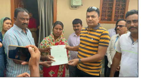
ಹೋಗುವ ರಸ್ತೆಯ ಅಕ್ಕಪಕ್ಕದ ಮನೆಗಳ ಸಾರ್ವಜನಿಕರೊಂದಿಗೆ ಮಾತನಾಡಿ ಕುಡಿಯುವ ನೀರಿನ ಬಗ್ಗೆ ಚರ್ಚಿಸಿದರು.

ವೇದಿಕೆಗೆ ಆಗಮಿಸಿದರು. ಕೊಟ್ಟೂರ ಸೇರಿದಂತೆ ಸುತ್ತಲಿನ ನಾನಾ ಹಳ್ಳಿಗಳ ಗ್ರಾಮಸ್ಥರ ಅಪವಾಲು ಆಲಿಸಿದರು. ಬೆಳಿಗ್ಗೆ 11.15ಕ್ಕೆ ಆರಂಭಗೊಂಡ ಕಾರ್ಯಕ್ರಮವು ಮಧ್ಯಾಹ್ನ 2.30 ಗಂಟೆವರೆಗೆ ಸತತವಾಗಿ ನಡೆಯಿತು.