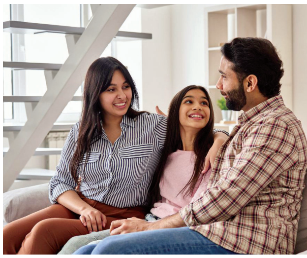
ವಿನಾಗಿರಬಹುದು ಎಂದು ಒಮ್ಮೆ ನಮ್ಮನ್ನು ನಾವೇ ಅವಲೋಕನ ಮಾಡಿಕೊಳ್ಳೋಣ.

ಒಂದು ಮಾತು "ಹೂವು ತಾನಾಗಿಯೇ ಅರಳುವುದು ಪ್ರಕೃತಿ" ಇದು ಸಹಜವಾದುದ್ದೇ ಆದರೆ ಅದನ್ನು ಒತ್ತಾಯ ಪೂರಕವಾಗಿ ಅರಳಿಸುವುದೂ ಇದೆ ವ್ಯವಹಾರಕ್ಕೇನು! ಇದು ವಿಕೃತಿ"ಯಲ್ಲದೆ ಮತ್ತೇನು? ಪಾಲಕರಾದ ನಾವು ಇಲ್ಲಿ ಮತ್ತೊಮ್ಮೆ ಸೂಕ್ಷ್ಮವಾಗಿ ಗಮನಿಸಬೇಕಾದ ಅಂಶವೇನೆಂದರೆ, ಮಕ್ಕಳಿಂದ ಯಾರು? ಈ ಮಕ್ಕಳು ಯಾರಿಗಾಗಿ? ನಮ್ಮ ಮಕ್ಕಳು ಏನನ್ನು ಕಲಿಯಬೇಕು? ಮತ್ತು ಅದನ್ನೇ ಏಕೆ ಕಲಿಯಬೇಕು? ಇಷ್ಟು ಅಂಶಗಳು ಪಾಲಕರಾದ ನಮಗೆ ಸ್ಪಷ್ಟವಾಗಿದ್ದರೆ ಸಾಕಿಸಿಸುತ್ತದೆ.