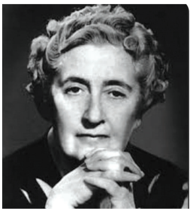
ಧಾರವಾಹಿಗಳ ರೂಪದಲ್ಲಿ ಇಂಗ್ಲೆಂಡ್ ಮತ್ತು ಯುನೈಟೆಡ್ ಸ್ಟೇಟ್ಸ್ ನ ನಿಯತಕಾಲಿಕಗಳಲ್ಲಿ ಪ್ರಕಟಗೊಳ್ಳುತ್ತಿದ್ದವು.