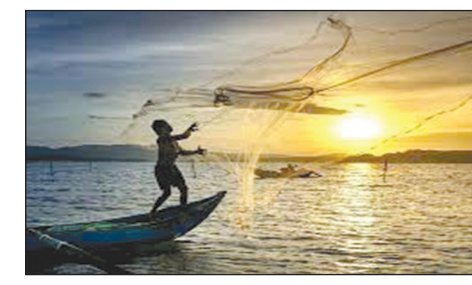
ಅರ್ಜಿ ಸಲ್ಲಿಸಲು ಫೆ.20 ಕೊನೆಯ ದಿನವಾಗಿದೆ. ಹೆಚ್ಚಿನ ಮಾಹಿತಿಗಾಗಿ ಮೀನುಗಾರಿಕೆ ಇಲಾಖೆಯ ಸಹಾಯಕ ನಿರ್ದೇಶಕರ ಮೊ.8970754167 ಮತ್ತು ಮೀನುಗಾರಿಕೆ ಇಲಾಖೆಯ ಉಪ ನಿರ್ದೇಶಕರ ಮೊ.9449593156 ಗೆ ಸಂಪರ್ಕಿಸಬೇಕೆಂದು ಎಂದು ಮೀನುಗಾರಿಕೆಯ ಉಪ ನಿರ್ದೇಶಕರು ಪ್ರಕಟಣೆಯಲ್ಲಿ ತಿಳಿಸಿದ್ದಾರೆ.

■ ಹಂಪಿ ಟೈಮ್ಸ್ ಬಳ್ಳಾರಿ ಮೀನುಗಾರಿಕೆ ಇಲಾಖೆ ವತಿಯಿಂದ 2023-24ನೇ ಸಾಲಿನ ಜಿಲ್ಲಾ ವಲಯ ವಿವಿಧ ಯೋಜನೆಗಳಡಿ ಅರ್ಹ ಫಲಾನುಭವಿಗಳಿಂದ ಅರ್ಜಿ ಆಹ್ವಾನಿಸಲಾಗಿದೆ. ಒಳನಾಡು ಮೀನುಗಾರಿಕೆ ಅಭಿವೃದ್ಧಿಗೆ ಸಹಾಯ ಯೋಜನೆಯಡಿ ಪರಿಶಿಷ್ಟ ಜಾತಿಯ ಮೀನು ಕೃಷಿಕರು ಮೀನು ಕೃಷಿ ಕೊಳ ನಿರ್ಮಾಣ ಮಾಡಲು 4.40 ಲಕ್ಷ ರೂ. ಹಣ (ಒಂದು ಹೆಕ್ಟೇರ್ ಕೊಳಕ್ಕೆ) ಸಹಾಯಧನ ನೀಡಲಾಗುತ್ತದೆ. ಅರ್ಹ ಅರ್ಜಿದಾರರು ಅಗತ್ಯ ದಾಖಲೆಗಳೊಂದಿಗೆ https://ballari.nic.in/ ವೆಬ್‌ಸೈಟ್‌ಗೆ ಭೇಟಿ ನೀಡಿ ಆನ್‌ಲೈನ್ ಮೂಲಕ ಅರ್ಜಿ ಸಲ್ಲಿಸಬಹುದು ಹಾಗೂ ಮೀನುಗಾರಿಕೆ ಇಲಾಖೆಯ ಸಹಾಯಕ ನಿರ್ದೇಶಕರ ಕಚೇರಿಯಲ್ಲೂ ಅರ್ಜಿ ಸಲ್ಲಿಸಬಹುದಾಗಿದೆ.