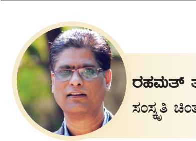
ರಹಮತ್ ತರೀಕೆರಿ ಸಂಸ್ಥೆ ಚಿಂತಕರು

ಕೊರತೆಯಿರುವುದನ್ನು ಒಪ್ಪಿಕೊಂಡರು. ಹಿಮಾಲಯಕ್ಕೆ ಆರೋಗ್ಯ ಹುಡುಕಿಕೊಂಡು ಹೋದವರಿಗೆ ಸ್ಥಳೀಯರ ನೂರಂಟು ಕಾಯಿಲೆ ಕಷ್ಟಗಳ ದರ್ಶನ. ಚಿಲ್ಲಿಕೊಂಡ ಮನೆಗಳಿರುವ ಹಿಮಾಲಯದಲ್ಲಿ ಆಧುನಿಕ ಶಿಕ್ಷಣ ಕಡಿಮೆ. ಸರ್ಕಾರಿ ನೌಕರಸ್ಮರಣ ಹೆಚ್ಚಿಲ್ಲ, ಬಹುಮಂದಿ ರೈತರು ಇಲ್ಲವೇ ಕೂಲಿಕಾರರು. ದುರ್ಗಮ ಕಾಡುಬೆಟ್ಟಗಳು ಆರ್ಥಿಕ ಸಾಮಾಜಿಕ ಹಿಂದುಳಿದಿರುವ ಕಾರಣವಾಗಿವೆ. ಯಮುನೋತ್ರಿ ಹಾದಿಯಲ್ಲಿರುವ ಸಾಯನಚಿಟ್ಟಿಯಲ್ಲಿ ಶಾಲಾಮಕ್ಕಳಿಗೆ 'ನಿಮಗೆ ಕಷ್ಟದ ಸಂಗತಿ ಯಾವುದು?' ಎಂದು ಕೇಳಿದೆ. ಶಾಲೆ ಬಿಟ್ಟು ಬಳಿಕ ಜಾರುವೆಲದಲ್ಲಿ ಮಳೆಯಲ್ಲಿ ಬೃಷ್ಟಿ ಮನೆ ತಲುಪುವುದು ಎಂದರು. ಗೌರಿಕುಂಡದಲ್ಲಿ ನನ್ನೂಡನೆ ಮಾತಾಡಿದ ಹೆಂಗಸು ಅಡುಗೆಗ್ಯಾರ್ ಇಲ್ಲದಿರುವುದು ದೊಡ್ಡ ಸಮಸ್ಯೆ ಎಂದಳು. ಆಕೆ ಜೀವನದಲ್ಲಿ ಓಟ ಕೂಡ ಹಾಕಿರಲಿಲ್ಲ.