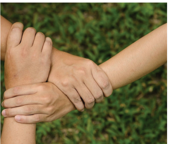
ನಾನು ಯಾವುದೇ ಕಾರಣಕ್ಕೂ ಸತ್ಯ ವತಿಗೆ ಆಗ್ನೇ ನನ್ನ ತಂದೆಗೆ ಆಗಲಿ ನಾನು ಮೋಸ ಮಾಡುವುದಿಲ್ಲ ನಾನು ಯಾವುದೇ ಕಾರಣಕ್ಕೂ ರಾಜನಾಗಬೇಕೆಂಬ ಆಸೆಯು ಇಲ್ಲ

ಸಾಧನಾ ಅವರಿಗೆ ಸಿಂಹಾಸನ ಸಿಗೋಕೆ ಸಾಧ್ಯ ಆಗುತ್ತಾ, ನೀನೇನಾದರೂ ನನ್ನ ಮಗ ಮಕ್ಕಳಿಗೆ ಎಲ್ಲಾ ಅನುಕೂಲಗಳನ್ನು ಮಾಡಿಕೊಡೋಡಿ ಅಂದ್ರೆ ಖಂಡಿತ ನನ್ನ ಮಗಗಳನ್ನು ನಿನ್ನ ಕೊಡ್ಡಿಗೆ ಅಂತ ಹೇಳಿದಾಗ ಅವನು ತುಂಬಾ ಬೇಸರದಿಂದ ಅಲ್ಲಿಂದ ಹೊರಡುತ್ತಾನೆ.