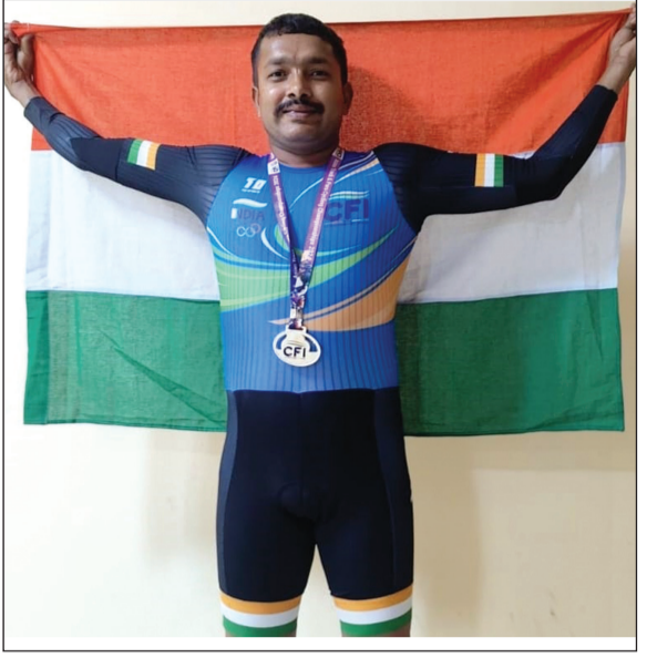
(ಗೋವಾ)ಟ್ರೈ ಗೋವಾ ಡುವಫ್ರಾನ್ಸ್ - ಕಂಚಿನ ಪದಕ. 2019 (ಕೊಲ್ಕಾಪುರ) ಡಿ.ಎಸ್. ಸಿ. ಕೊಲ್ಕಾಪುರ ಡುವಫ್ರಾನ್ಸ್ - ಚಿನ್ನದ ಪದಕ...