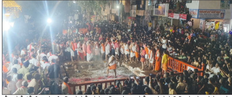
ಹೊಸಪೇಟೆ ಶ್ರೀ ಸಣ್ಣಕಿ ವಿರಭದ್ರೇಶ್ವರಸ್ವಾಮಿ ಮಹಾರಥೋತ್ಸವದ ನಿಮಿತ್ತ ಮಂಗಳವಾರ ಸಂಜೆ ಅಗ್ನಿಕುಂಡದಲ್ಲಿ ಬೆಂಕಿಯನ್ನು ಶ್ರದ್ಧಾಭಕ್ತಿಯಿಂದ ಹಾಯ್ದು ಹರಕೆ ಸಮರ್ಪಿಸಿದರು.

ಜರುಗಿದ ರಥೋತ್ಸವದಲ್ಲಿ ನಗರ ಸೇರಿದಂತೆ ವಿವಿಧ ಜಿಲ್ಲೆಗಳಿಂದ, ಗ್ರಾಮಗಳಿಂದ ಭಕ್ತರು ಆಗಮಿಸಿ ರಥೋತ್ಸವಕ್ಕೆ ಉತ್ಸುಕಿ, ಬಾಳೆಹಣ್ಣು ಎಸೆದು ಭಕ್ತಿ ಸಮರ್ಪಿಸಿದರು. ದೇವಸ್ಥಾನ ಆಡಳಿತ ಮಂಡಳಿ ಸದಸ್ಯರು ಈ ಬಾರಿ ದೇವರ ದರ್ಶನಕ್ಕಾಗಿ ಭಕ್ತರಿಗೆ ವಿಶೇಷ ವ್ಯವಸ್ಥೆ ಕಲ್ಪಿಸಿದ್ದರು. ಪೊಲೀಸರು ಸೂಕ್ತ ಭದ್ರತೆ ಒದಗಿಸಿದ್ದರು. ಜಾಗೃತ ನಾಯಕ ಬಳಗ ಸೇರಿದಂತೆ ಇತರ ಸಂಘಟನೆಗಳು ಭಕ್ತರಿಗೆ ತಂಪು ಪಾನೀಯ, ಮಜ್ಜಿಗೆ, ನೀರಿನ ವ್ಯವಸ್ಥೆ ಮಾಡುವ ಮೂಲಕ ಸೇವೆ ಸಲ್ಲಿಸಿದರು.