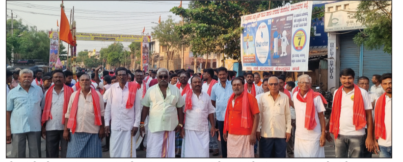
ಹೊಸಪೇಟೆ ಶ್ರೀ ಸಣ್ಣಕಿ ವಿರಭದ್ರೇಶ್ವರಸ್ವಾಮಿ ಮಹಾರಥೋತ್ಸವಕ್ಕೆ ಸಂಪ್ರದಾಯದಂತೆ ಸನ್ನೆ ಹಾಕಲು ಮೇದಾರ ಸಮಾಜದ ಹಿರಿಯರು ಹೊಸಪೇಟೆ ಹಾರದೋದಿಗೆ ಯುವಕರನ್ನು ಕರೆದೊಯ್ದ ಕ್ಷಣ.