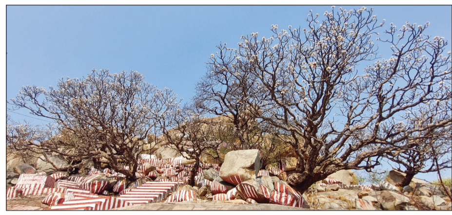
ಹೊಸಪೇಟೆ ತಾಲೂಕಿನ ನಾಗೇನಹಳ್ಳಿ ಸಮೀಪದ ಧರ್ಮದಗುಡ್ಡದಲ್ಲಿ ಕಲ್ಲುಬಂಡೆಗಳ ಮಧ್ಯೆ ಬೃಹದಾಕಾರವಾಗಿ ಚನ್ನಬಸವೇಶ್ವರ ಸ್ವಾಮಿಯ ಪೂಜೆಗೋಡೆ ಬೆಳೆದು ನಿಂತಿರುವ ದೇವಗಣಗಲಿ ಮರ ಎಲೆ ಇಲ್ಲದಿದ್ದರೂ ಮರದ ತುಂಬು ಹೂಬಿಟ್ಟು ನೋಡುಗರನ್ನು ಆಕರ್ಷಿಸುತ್ತಿದೆ.