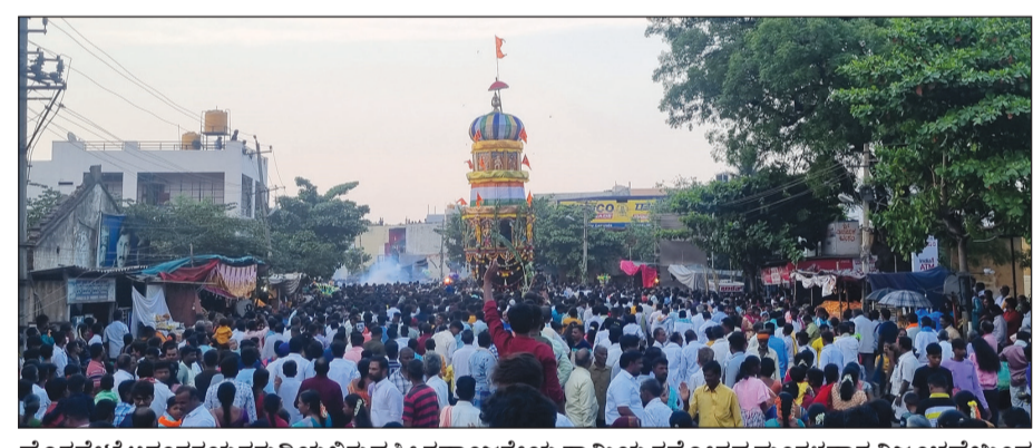
ಹೊಸಪೇಟೆ ಅನಂತಶಯನಗುಡಿಯಲ್ಲಿರುವ ಶ್ರೀ ಸಪ್ತಾಂಜನೇಯ ಸ್ವಾಮಿಯ ರಥೋತ್ಸವ ಮಂಗಳವಾರ ವಿಜೃಂಭಣೆಯಿಂದ ಜರುಗಿತು. ನಗರ ಹಾಗೂ ಗ್ರಾಮೀಣ ಪ್ರದೇಶಗಳ ಭಕ್ತರು ಬಾಳೆ ಹಣ್ಣು ಎಸೆದು ಭಕ್ತ ಸಮರ್ಪಿಸಿದರು.