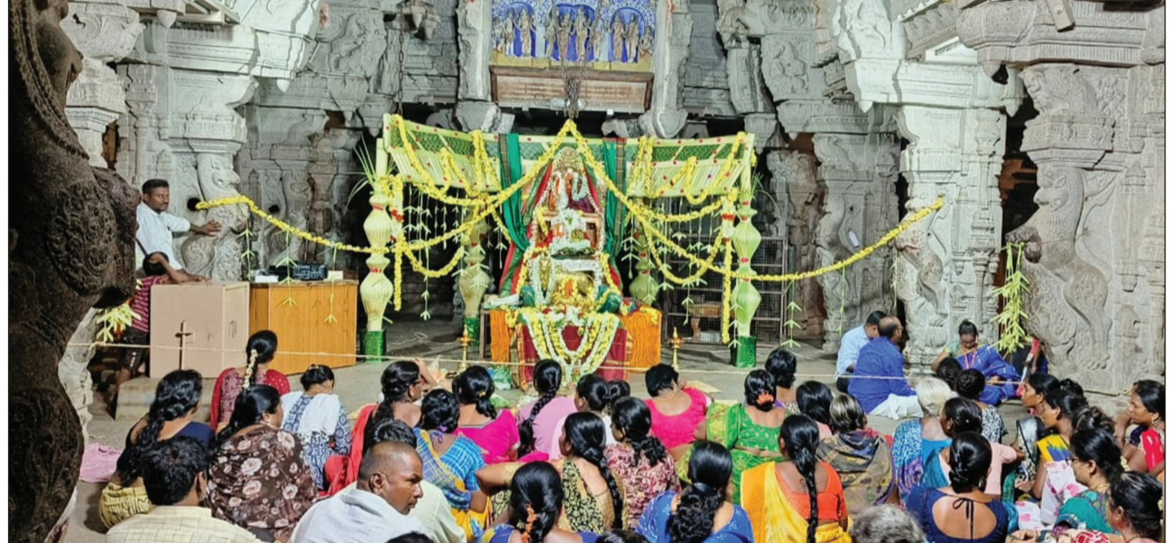
ದಕ್ಷಿಣ ಕಾಶಿ ಹಂಪಿಯಲ್ಲಿ ಭಾನು ಶ್ರೀ ವಿರೂಪಾಕ್ಷೇಶ್ವರ ದೇವಸ್ಥಾನದಲ್ಲಿ ಶ್ರೀ ಪಂಪ ವಿರೂಪಾಕ್ಷೇಶ್ವರ ಹಾಗೂ ಪಾರ್ವತಿಯ ಕಲ್ಯಾಣೋತ್ಸವ ಕಾರ್ಯಕ್ರಮ ನಡೆಸಲಾಯಿತು. ಶಿವ ಪಾರ್ವತಿಯ ಕಲ್ಯಾಣೋತ್ಸವವನ್ನು ಭಕ್ತರು ಶ್ರದ್ಧಾಭಕ್ತಿಯಿಂದ ಕೇಂದ್ರಿಸಿಕೊಂಡರು.