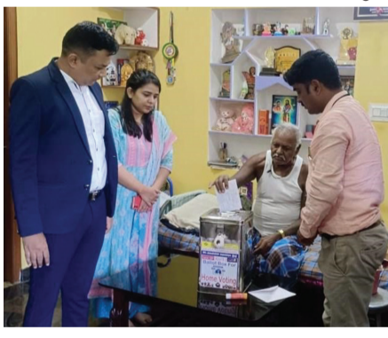
ವಿಜಯನಗರ ಜಿಲ್ಲೆಯಲ್ಲಿ ಒಟ್ಟು 721 ಹಿರಿಯ ನಾಗರಿಕ ಮತದಾರರು 487 ವಿಶೇಷಜೀತನ ಮತದಾರರಿದ್ದಾರೆ.