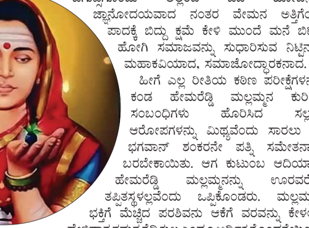
ವಿಕಾರಗಳಿಗೋಳಾಗಿ ವಾನವನ ದೇಹ ಎಂದರೆ ಇಷ್ಟೇನೇ ಎಂದು ಜಗನ್ನಾಥನ ಅತ್ತಿರದ ಒಡಿ ಹೋದನು. ಜ್ಞಾನೋದಯವಾದ ನಂತರ ವೇಮನ ಅತ್ತಿಗೆಯ ಪಾದಕ್ಕೆ ಬಿದ್ದು ಕ್ಷಮೆ ಕೇಳಿ ಮುಂದೆ ಮನೆ ಬಿಟ್ಟು ಹೋಗಿ ಸಮಾಜವನ್ನು ಸುಧಾರಿಸುವ ನಿಟ್ಟಿನಲ್ಲಿ ಮಹಾಕವಿಯಾದ, ಸಮಾಜೋದ್ಧಾರಕನಾದ.

ಇದಕ್ಕೊಪ್ಪಿದ ವೇಮನ ಮೂಗುತಿಯನ್ನು ಅತ್ತಿಗೆಯಿಂದ ಪಡೆದು ವೇಶ್ಯಾ ಬಳಿ ಸಾರಿ ಅತ್ತಿಗೆಯ ಪರತನ್ನು ಹೇಳಿದ. ಅದನ್ನು ಕೇಳಿದ ಆಕೆ ತಕ್ಕೋವೆ ಶರತ್ತಿಗೆ ಒಪ್ಪಿ ನಿರ್ವಾಣ ಸ್ಥಿತಿಯಲ್ಲಿ ಮೂಗುತಿಯನ್ನು ಪಡೆದಳು. ಆಕೆಯನ್ನು ನಿರ್ವಾಣ ಸ್ಥಿತಿಯಲ್ಲಿ ನೋಡಿದ ವೇಮನ ಭಯಂಕರ ಕ್ಷೋಭೆ