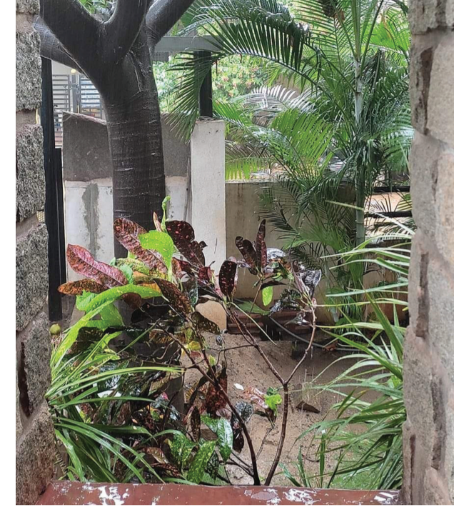
ದೃಶ್ಯಗಳನ್ನು ಜನ ತಪಾಸಣೆ ಮಾಡುತ್ತ ತಿರುಗುತ್ತಿದ್ದರು. ಪತ್ರಿಕೆಯ ತುಂಬ ಏರಿ ಒಡೆದ, ಗದ್ದೆ ಕೊಚ್ಚಿಹೋದ, ಕಡಲೆಕ್ಕರತದಲ್ಲಿ ತೆಂಗಿನಮರ ಉರುಳಿದ ಸುದ್ದಿಗಳು.

ಕಚ್ಚಿಕೊಂಡ ಮಳೆ ನಿಂತು ತುಸು ಹೊರಪುಗೊಟ್ಟರೆ ಸಗ್ಗದ ಬಾಗಿಲು ತೆರೆಯುತ್ತಿತ್ತು. ಬೂದಿಬುಡುಕ ಆಗಸ ನೋಡಿ ಸಾಗಾಗಿದ್ದ ಮನ, ಸೂರ್ಯನ ಬೆಳಿಮುಖ ಕಂಡು ಅರಳುತ್ತಿತ್ತು. ಕೊಡಗಿನ ಮಳೆಪುಷ್ಪದಲ್ಲಿರುವಾಗ ಮಳೆಬಿದ್ದ ಮಾರನೇ ಬೆಳಿಗ್ಗೆ ನಾನು-ಬಾನು, ತಿರುಗಾಟಕ್ಕೆ ಹೊರಟಿದ್ದೆವು. ಗೊಪ್ಪಹಾಕಿಕೊಂಡು ಕೆಲಸಗಾರರು ಗುದ್ದಲಿ ಕೊಡಲಿ ಮುಟ್ಟಿ ಹಿಡಿದು ಲೈಸಿನ ಮನೆಗಳಿಂದ ಏರುತ್ತ ಇರುವ ಸಾಲಾಗಿ ಎದುರಾದರು. ಕೆಲವರು ಪ್ಲಾಸ್ಟಿಕ್ ಹಾಳೆ ಸುತ್ತಿಕೊಂಡು, ಕಾಲಿಗೆ ಗಂಶೂ ಹಾಕಿಕೊಂಡು ಪ್ರಾಣಿಗಳಿದ್ದರು. ಹೆಂಗಸರು ತಾಂಬೂಲ ಹಾಕಿ ಬಾಯಿ ಕಿಂಪಾಗಿ ಮಲ್ಲಿಗೆ ಮುಡಿಗಿದ್ದರು. ಗಂಡಸರು ಬಹುಶಃ ಕುಡಿಕುಡಿದು ಕನ್ನೆಬಿಟ್ಟು ಮುಖಿಕ್ಕಿರ ಬೆಳೆದು - ಚಲಿಸುವ ಕಳೇಬರಗಳಂತೆ ಕಂಡರು. ಅವರೆಲ್ಲ ಬರಿದ ಗಡ್ಡೆಯ ಮಣ್ಣೆತ್ತಲು, ಕಾಫಿಗಡೆದ ಮೇಲೆ ಬಿದ್ದಿದ್ದ ಮರ ಕಡಿಯಲು ಹೊಂಟಿದ್ದರು. ದೊಡ್ಡಮಳೆ ಬಂದು ನಿಂತೊಡನೆ ಅಪ್ಪ ಕೂಡ ಹೊಲಕ್ಕೆ ನೀರು ನುಗ್ಗಿ ಎಲ್ಲಿ ಬದುಗಳು ಒಡೆದವೋ ಎಂದು ಗುದ್ದಲಿ ಹಿಡಿದು ಓಡುತ್ತಿದ್ದನು. ನಮ್ಮ ಬಡಾವಣೆಯಂತೂ ಯುದ್ಧಭೂಮಿ. ಗೋಡೆ ಕುಸಿದ, ಭತ್ತು ಹಾರಿಹೋದ, ಒಪ್ಪಾರ ಬಾಗಿಡ, ಮರ ಬಿದ್ದ, ಮುದುಕಿ ಪ್ರಾಣಿಬಿಟ್ಟ