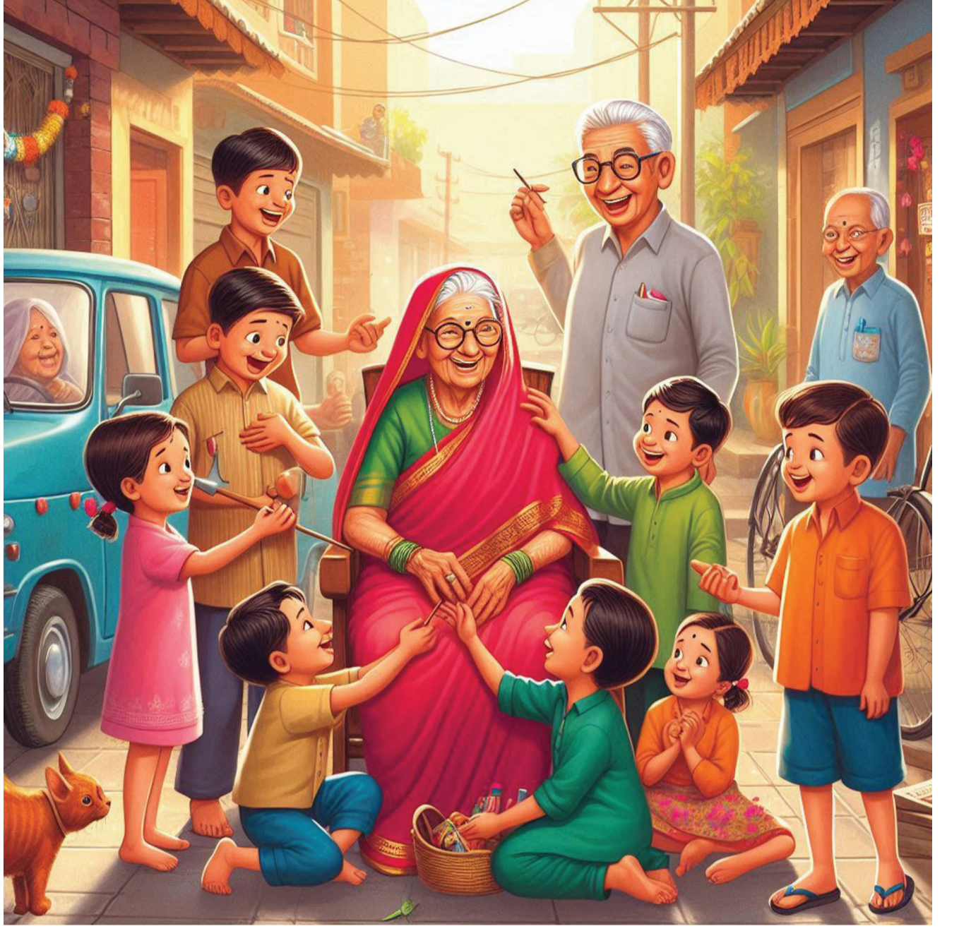
ಬಾಡಿಗೆ ಕಟ್ಟಿದರೆ ಮತ್ತೊಮ್ಮೆ ನೀವು ಕಡ್ಡಾಯವಾಗಿ ಕಟ್ಟಲೇಬೇಕು ಎಂಬುದನ್ನು ಮರೆಯಬೇಡಿ.