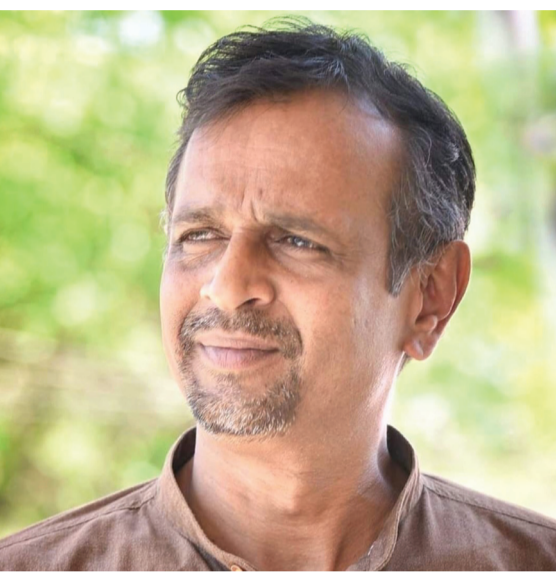
"ಕಲ್ಪು ಕಲ್ಲು ಚಿತ್ರ ಇರುತ್ತೆ" ಎನ್ನುವ ಕವನದಲ್ಲಿನ ಕೊನೆಯ ಸಾಲುಗಳು