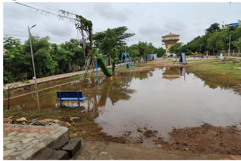
ಹೊಸಪೇಟೆ ವಿನಾಯಕನಗರ ಬಡಾವಣೆಯ ಉದ್ಯಾನವನಕ್ಕೆ ಮಳೆ ನೀರು ನುಗ್ಗಿರುವುದು

■ ಹಂಪಿ ಟೈಮ್ಸ್ ಹೊಸಪೇಟೆ ಹೊಸಪೇಟೆ ತಾಲೂಕಿನಲ್ಲಿ ಭಾನುವಾರ ರಾತ್ರಿ 58.17 ಎಂ.ಎಂ. ಮಳೆಯಾಗಿದ್ದು, ಒಂದು ಗಂಟೆಗೂ ಅಧಿಕ ಸುರಿದ ಮಳೆಯಿಂದಾಗಿ ನಗರದ ಹೊರವಲಯದ ರಾಯರ ಕೆರೆಯಲ್ಲಿ ಬೆಳೆದ ಬೆಳೆಗಳು ಜಲಾವೃತಗೊಂಡಿದ್ದು, ರೈತರು ಆತಂಕಕ್ಕೆ ಸಿಲುಕಿದ್ದಾರೆ. ವಿನಾಯಕ ನಗರ ಬಡಾವಣೆಯ ಉದ್ಯಾನವನ ಸೇರಿದಂತೆ ನಗರದ ಅನೇಕ ತಗ್ಗು ಪ್ರದೇಶಕ್ಕೆ ನೀರು ನುಗ್ಗಿದ್ದು, ಜನಸಂಚಾರ ಮತ್ತು ವಾಯುವಿಹಾರಕ್ಕೂ ತೆರಳದಂತಾಗಿದೆ. ಈ ಭಾಗದ ನಿವಾಸಿಗಳು, ಮಕ್ಕಳು, ವಯೋವೃದ್ಧರು ಸೇರಿದಂತೆ ವಿಶೇಷ ಚೇತನರು ಒಳಹೋಗದಂತೆ ನೀರು ತುಂಬಿದೆ. ಉದ್ಯಾನವನವನ್ನು ಸುಸ್ಥಿತಿಗೆ ತರುವಂತೆ ವಿನಾಯಕನಗರ ಕ್ಷೇಮಾಭಿವೃದ್ಧಿ ಸಂಘದ ಸದಸ್ಯರುಗಳು ಈ ಹಿಂದಿನಿಂದಲೂ ನಗರಸಭೆ ಪೌರಾಯುಕ್ತರ ಗಮನಕ್ಕೆ ತಂದರೂ ಪ್ರಯೋಜನವಾಗಿಲ್ಲ. ಇನ್ನಾದರೂ ಸ್ಪಂದಿಸಲಿ ಎಂದು ಎಂದು ಎಸ್.ಎಂ.ಭಾಷ ಬತ್ತಾಯಿಸಿದರು.