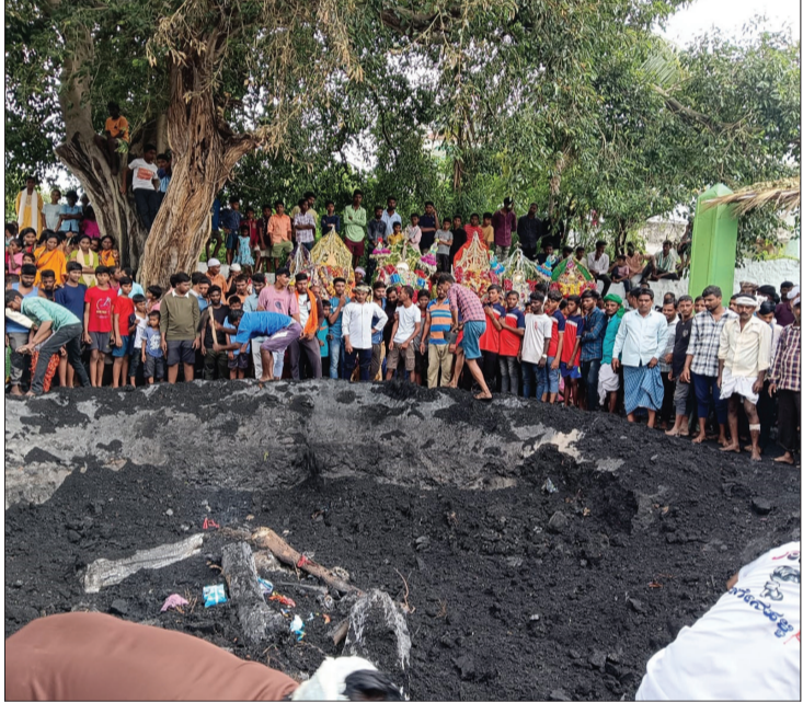
ಹೊಸಪೇಟೆ ತಾಲೂಕಿನ ನಾಗೇನಹಳ್ಳಿಯಲ್ಲಿ ಕುಣಿ ಮುಟ್ಟಿರುವ ಕ್ಷಣ