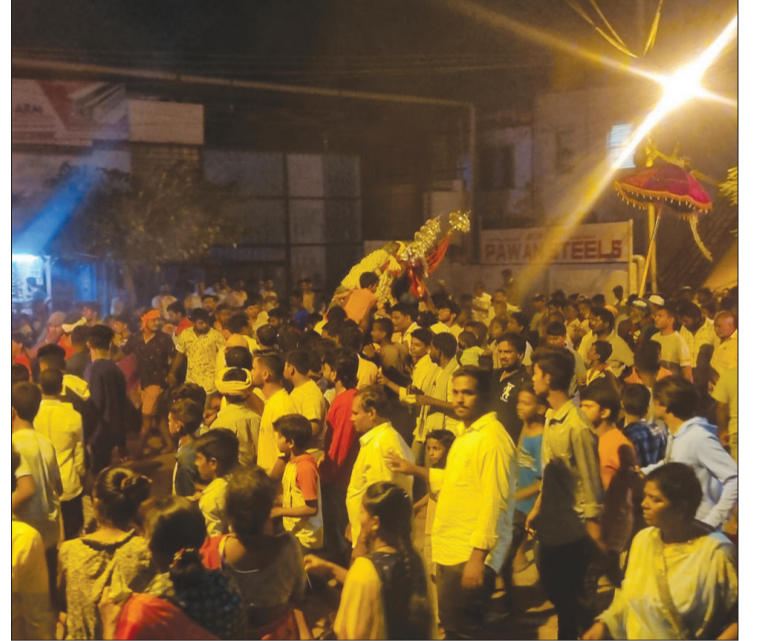
ಹೊಸಪೇಟೆಯಲ್ಲಿ ಹೋಳಿಗೆ ಹೋಗುವ ಮುನ್ನ ನಗರದಲ್ಲಿ ಸಂಚರಿಸಿದ ಕ್ಷಣ