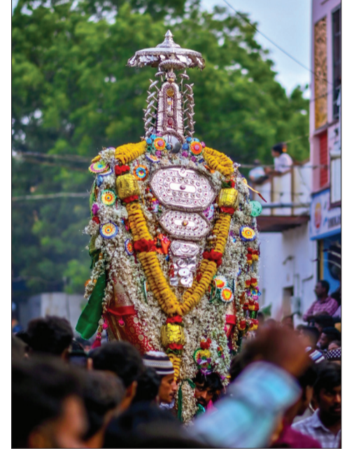
ಹೊಸಪೇಟೆ ತಾಲೂಕಿನ ಕಮಲಾಪುರದಲ್ಲಿ ಸಂಚಾರ ಸ್ವಾಮಿ