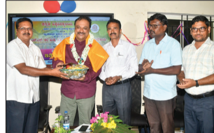
ಕನ್ನಡ ವಿಶ್ವವಿದ್ಯಾಲಯದ ನುಡಿಗಟ್ಟಡದಲ್ಲಿ ಬುಧವಾರ ಪ್ರಾಚೀನ ಇತಿಹಾಸ ಮತ್ತು ಪುರಾತತ್ವ ಅಧ್ಯಯನ ವಿಭಾಗ ಹಾಗೂ ಜಮಖಂಡಿಯ