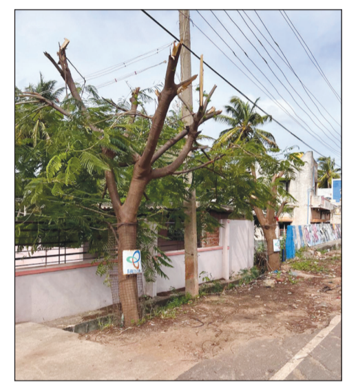
ಗಿಡಮರಗಳು ಈಗ ಎಲೆ ಹೂವಿಲ್ಲದಂತಾಗಿ ದೃಷ್ಟಿಯೊಂದಿಗಿನಂತೆ ನಿಂತಿರುವುದನ್ನು ನೋಡಿದ ಮಾನವೀಯ ಮನಸ್ಸುಗಳು ಮಮಲ ಮರುಗುತ್ತಿವೆ. ಗಿಡಮರಗಳನ್ನು ಹೀಗೆ ನಗರದಾದ್ಯಂತ ಕಡಿಯುತ್ತಾ ಹೋದರೆ ನಗರ ಹಸಿರಿಲ್ಲದಂತಾಗಿ ನಗರದ ಸೌಂದರ್ಯವೇ ಹಾಕಾಗಲಿದೆ. ಮರುಗಳು ಕಾರ್ಬನ್ ಡೈಆಕ್ಸೈಡ್ ಪಡೆದು, ಜೀವರಾಶಿಗಳಿಗೆ ಅಮೃತಜನಕ

ಬಿಡುಗಡೆ ಮಾಡುತ್ತದೆ. ಮರ ಕಡಿಯುವುದರಿಂದ ಹವಾಮಾನ ಬದಲಾವಣೆಯಾಗಿ ಮತ್ತಷ್ಟು ಗೋಲ್ಡ್ ವಾರ್ಡ್‌ನಿಗೆ ಕಾರಣವಾಗಬಹುದಾಗಿದೆ. ಮರಗಳನ್ನು ಅರ್ಧಭಾಗವನ್ನು ಕಡಿಯುವುದರಿಂದ ಮಣ್ಣಿನ ಮೇಲಿನ ಹಿಡಿತ ಮರಗಳಿಗೆ ಕಡಿಮೆಯಾಗುತ್ತದೆ. ಅಲ್ಲದೆ ಮರ ನೀರಿನಡಿಹುಟ್ಟಿಕೊಳ್ಳುವ ಸಾಮರ್ಥ್ಯವನ್ನು ಕಳೆದುಕೊಳ್ಳಲಿದೆ. ಮರಗಳಿದ್ದರೆ ಮಾತ್ರ ಮಳೆಗಾಲದ ನೀರನ್ನು ತಕ್ಕಮಟ್ಟಿಗೆ ಹಿಡಿದಿಟ್ಟುಕೊಳ್ಳುತ್ತವೆ. ಮರಗಳ ಕತ್ತರಿಸುತ್ತಾ ಹೋದರೆ ಬರ ಬಂದೆರಗುತ್ತದೆ. ಗಿಡಮರಗಳನ್ನು ಬೋಳಾಗಿಸಿದರೆ ಗಿಡಮರಗಳನ್ನು ಅವಲಂಬಿಸಿದ ಪ್ರಾಣಿ, ಪಕ್ಷಿಗಳು ವಾಸಸ್ಥಾನಗಳನ್ನು ನಾಶಗೊಳಿಸಿದಂತಾಗುತ್ತದೆ. ಮರಗಳಿಂದ ಅನಾಹುತ ಎದುರಾಗಬಹುದು ಎನ್ನುವ ಜಿಸ್ಕಾಂ ಸಿಬ್ಬಂದಿಗೆ ಪರಿಸರದ ಕುರಿತು ಅರಿವಿನ ಅಗತ್ಯವಿದೆ. ನಗರದ ನಾನಾ ಕಡೆ ವಿದ್ಯುತ್ ತಂತಿಗಳ ಬದಲಿಗೆ ಎಬಿಸಿ ಕೇಬಲ್ ಹಾಕಲಾಗಿದೆ. ಅದರಂತೆ ಗುಣಮಟ್ಟದ, ಬಳಕೆಯ ಸಾಮರ್ಥ್ಯಕ್ಕೆ ತಕ್ಕದಾದ ವಿದ್ಯುತ್ ತಂತಿಯ ಬದಲಿಗೆ ಕೇಬಲ್ ಹಾಕಿದರೆ ಪರಿಸರವನ್ನು ಸಂರಕ್ಷಿಸಿದಂತಾಗುತ್ತದೆ. ಅಪಾಡ ಗಾಳಿಯಿಂದಾಗುವ ವಿದ್ಯುತ್ ಅಪಘಾತಗಳಿಂದತೂ ತಪ್ಪಿಸಿಕೊಂಡಾಗುತ್ತದೆ. ಜಿಸ್ಕಾಂ ಅಧಿಕಾರಿಗಳು, ಅರಣ್ಯಾಧಿಕಾರಿಗಳು, ನಗರಸಭೆ ಸೇರಿದಂತೆ ಸಂಬಂಧಿಸಿದ ಅಧಿಕಾರಿಗಳು ಪರಿಸರ ರಕ್ಷಣೆಗೆ ಆದ್ಯತೆ ನೀಡಬೇಕೆನ್ನುವುದು ಪರಿಸರ ಪ್ರೇಮಿಗಳ ಒತ್ತಾಯವಾಗಿದೆ.