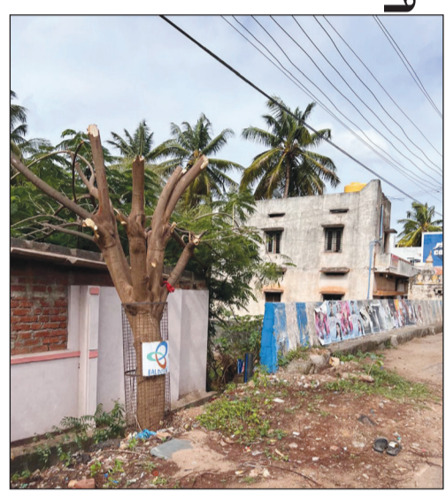
ತಿಳಿಯದಂತಾಗಿ, ಜಿಸ್ಕಾಂ ಕಾರ್ಯಕ್ಕೆ ಹಿಡಿತಾಪ ಹಾಕುತ್ತಾ ಮುನ್ನಡೆಯುತ್ತಿರುವುದು ಸಾಮಾನ್ಯವಾಗಿದೆ. ಒಂದು ಗಿಡ ಮರವಾಗಬೇಕಾದರೆ ಹತ್ತಾರು ವರ್ಷಬೇಕಾಗುತ್ತದೆ. ಬೆಳೆದು ನಿಂತ ಗಿಡಮರಗಳಿಂದ ಸಿಗುವ ಅಮೃತಜನಕವನ್ನು ಉಚಿತವಾಗಿ ಪಡೆದು ಆರೋಗ್ಯವಾಗಿದ್ದೇವೆ. ಅಡಮಿಯಲ್ಲಿ ಮರಗಳನ್ನು ಕಡಿದರೆ ಮಾತ್ರ ಗಿಡಗಳ ಮಾರಣ ಹೋಮವೇ? ನಗರದಲ್ಲಿ ಹಚ್ಚುಹಸಿರಿನಿಂದ ಕೂಡಿದ್ದ

■ ಹಂಪಿ ಟೈಮ್ಸ್ ಹೊಸಪೇಟೆ ಸಕಲ ಜೀವರಾಶಿಗಳ ಉತ್ತಮ ಆರೋಗ್ಯ ಅಡಗಿರುವುದು ಗಿಡಮರಗಳ ಬೀಜವು ಗಾಳಿಯಲ್ಲಿ ಎಂಬುದನ್ನು ಅರಿತ ಪರಿಸರ ಪ್ರೇಮಿಗಳು, ಅರಣ್ಯ ಇಲಾಖೆ ಸಿಬ್ಬಂದಿ ವಿವಿಧ ಸಂಘ ಸಂಸ್ಥೆಗಳ ಸಹಕಾರದೊಂದಿಗೆ ಮಳೆಗಾಲದಲ್ಲಿ ಗಿಡ ನೆಟ್ಟು ಸಂರಕ್ಷಿಸಲು ಜಾಗೃತಿ ಮೂಡಿಸುತ್ತಾ ಬರುತ್ತಿದ್ದಾರೆ. ವಿಶ್ವ ಪರಿಸರ ದಿನಾಚರಣೆಯಂಥವಾಗಿ ನಾನಾ ಸಂಘ ಸಂಸ್ಥೆಗಳು, ಅಧಿಕಾರಿಗಳು ಮಕ್ಕಳೊಂದಿಗೆ ಗಿಡ ನೆಟ್ಟು ಜಾಗೃತಿ ಭಾಷಣಗಳನ್ನು ಮಾಡುತ್ತಾರೆ. ಗೋಲ್ಡ್ ವಾರ್ಡ್‌ನಿಂದ ಪಾರಾಗಲು ವಿದ್ಯಾರ್ಥಿಗಳು ತಮ್ಮ ಹುಟ್ಟುಹಬ್ಬಕ್ಕೊಂದು ಗಿಡ ನೆಡಿ ಎಂಬ ಜಾಗೃತಿ ಮೂಡಿಸಲಾಗುತ್ತಿದೆ. ಆದರೆ ಜಿಸ್ಕಾಂ ಸಿಬ್ಬಂದಿ ಗಿಡಮರಗಳ ರುಂಡ ಚೆಂಡಾಡುತ್ತಿದ್ದರೂ, ನಮ್ಮನ್ನು ರಕ್ಷಿಸುವವರಿಲ್ಲವಲ್ಲ ಎಂದು ಗಿಡಮರಗಳು ರೋಧಿಸುತ್ತಿರುವುದು ಅಧಿಕಾರಿಗಳ ಕಣ್ಣಿಗೆ ಬೀಳದಿರುವುದು ವಿಪರ್ಯಾಸವೆ ಸರಿ.