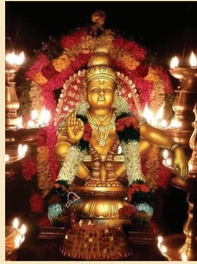
ಶರಣ ಹರಿಹರ ತನಯಾ ಮಣಿಕಂಠ ಜ್ಯೋತಿ ಸ್ವರೂಪ ಕಲಿಯುಗ ವರದಾ ದಯಾ ತೋರೋ

ಅಯ್ಯಪ್ಪ ಕಾಯೊ ತಂದೆ ನಾ ನಿನ್ನ ನೋಡಲೆಂದೆ ಇರುಮುಡಿಯ ಹೊತ್ತು ಬಂದೆ ಬೇಡಿ ದರ್ಶನ ||ಅಯ್ಯಪ್ಪ||