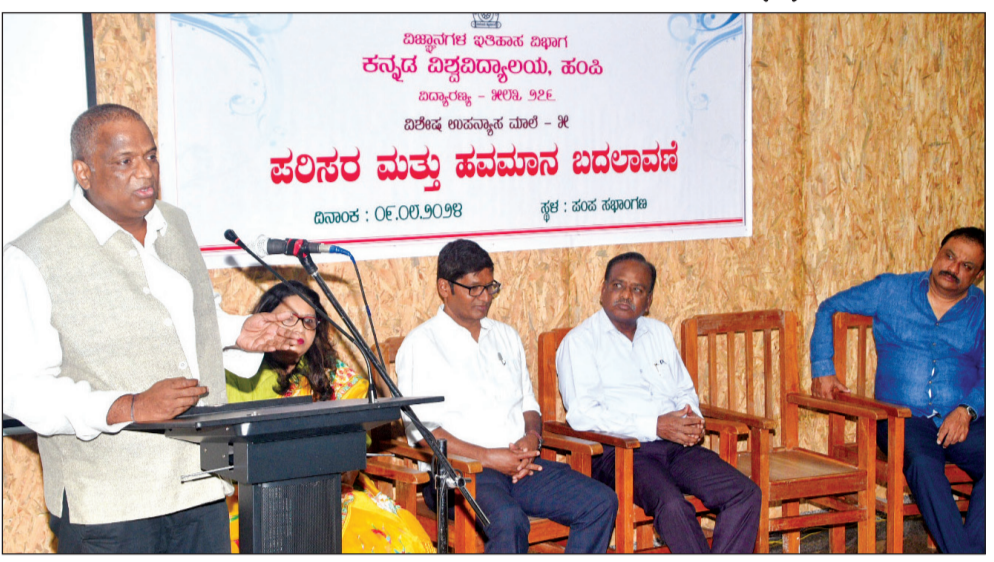
ಮಾತನಾಡಿ, ಅಭಿವೃದ್ಧಿಯ ಹೆಸರಿನಲ್ಲಿ ಇಂದು ಪರಿಸರದ ವಿನಾಶ ಹೆಚ್ಚುತ್ತಿದೆ. 1972 ರಲ್ಲಿ ಮೊದಲ ಬಾರಿಗೆ ಪರಿಸರ ಜಾಗೃತಿ ಕುರಿತಂತೆ ವಿಶ್ವಸಂಸ್ಥೆಯಲ್ಲಿ ಸಭೆ ನಡೆಸಲಾಯಿತು. ಈ ಸಭೆಯಲ್ಲಿ ಜಗತ್ತಿನ ವಿವಿಧ ದೇಶಗಳು ಪಾಲ್ಗೊಂಡು ಪರಿಸರ ಸಂರಕ್ಷಣೆ ಬಗ್ಗೆ ಚರ್ಚೆ ನಡೆಸಿದವು. ಇದರ ಸವಿನೆನಸಿಗಾಗಿ ಪ್ರತಿವರ್ಷ ಜೂನ್ 5 ರಂದು ವಿಶ್ವ ಪರಿಸರ ದಿನಾಚರಣೆಯನ್ನು ಆಚರಿಸಲಾಗುತ್ತದೆ. ಭಾರತದಲ್ಲಿ ಭೂಪಾಲ್ ಅನಿಲ್ ದುರಂತದ ನಂತರ ಎಚ್ಚೆತ್ತುಕೊಂಡ ಸರ್ಕಾರ 1985