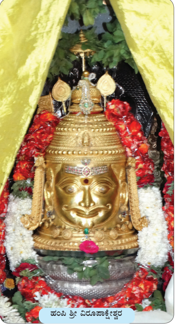
ಹಂಪಿ ಶ್ರೀ ವಿರೂಪಾಕ್ಷೇಶ್ವರ