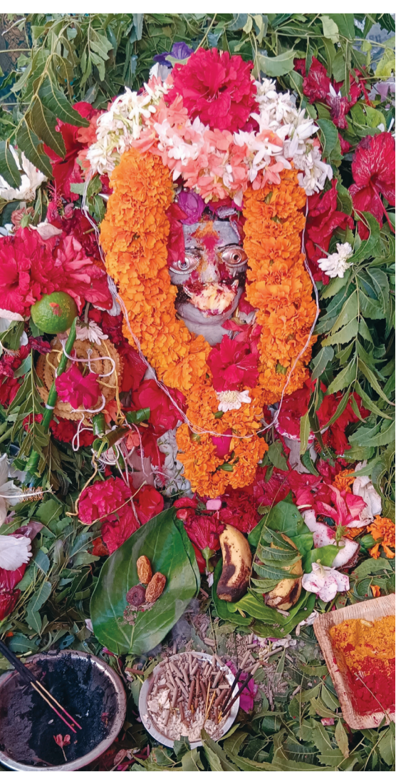
ಜೋಕುಮಾರನ ವಿಶೇಷ ನಂತರ ಮೂರು ದಿನಗಳ ಕಾಲ ಮಡಿವಾಳರು ಬಟ್ಟೆ ಒಗೆಯುವಂತಿಲ್ಲ ಎಂಬುದು ಪ್ರತೀತಿ.

ಏಳನೇ ದಿನ ಜೋಕುಮಾರ ಕೇರಿಗೆ ಹೋಗಿ ಗೊತ್ತು ಮಾಡಿದ ಮಹಿಳೆಯಿಂದ ಲೀಲೆಯನ್ನು ಜನಪದ ಹಾಡಿನ ರೂಪದಲ್ಲಿ ಸುತ್ತಾಪ್ತವಾಗಿ ಮುಕ್ತ ಕಂಠದಿಂದ ಹಾಡಿ ಹೊಗಳುತ್ತಾರೆ. ಏಳನೇ ದಿನ ಜೋಕುಮಾರ ಕೇರಿಗೆ ಹೋಗಿ ಗೊತ್ತು ಮಾಡಿದ ಮಹಿಳೆಯಿಂದ ಜೊರಿ ಹಾಕಲ್ಪಟ್ಟು ಸಾಯಿತ್ತಾನೆ.ನಂತರ ಸತ್ತ ಜೋಕುಮಾರನನ್ನು ಅಗಸರು ಬಟ್ಟೆ ಒಗೆಯುವ ಹಳ್ಳದ ದಂಡೆಗಳಲ್ಲಿ,ಕೆರೆಗಳಲ್ಲಿ ನದಿಗಳಲ್ಲಿ ಒಯ್ದು ಬಿಸಾಕುತ್ತಾರೆ.