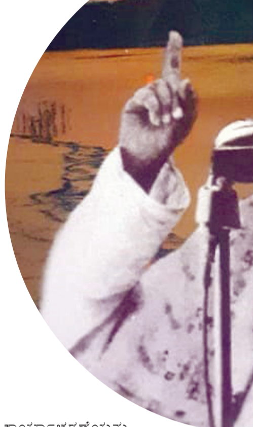
ಪ್ರಾಂತ್ಯದೊಳಗೆ ನುಗ್ಗಿ ರಜಕಾರರನ್ನು ಸಲಹೆ ಮಾಡಿದವರಿಗೆ ರೂಪಾಯಿ 10,000ಗಳ ಬಹುಮಾನವನ್ನು ನಿಜಾಮ ಸರ್ಕಾರ ಘೋಷಿಸಿತು. ಅಷ್ಟೇ ಅಲ್ಲದೆ ಸ್ವಾಮಿಗಳ ಸಿದ್ಧೇಶ್ವರ ಮಠದಿಂದ ಬೆಲೆಬಾಳುವ ವಸ್ತುಗಳನ್ನು ರಜಾಕಾರರು ದೋಚಿದರು. ಅವರ ಮನೆಯ ಸಾಮಾನುಗಳನ್ನು 16 ಲಾಂಛಿಗಳಲ್ಲಿ ಸಾಗಿಸಿದರೆ ಇಂಥ ಸೇಡಿನ ಹೀನ ಕ್ರಮಕ್ಕೂ ಕುಗ್ಗದೆ ಕಪ್ಪತ್ತಗುಡ್ಡದಲ್ಲಿ ಭೂಗತರಾಗಿ ಕಾರ್ಯಾಚರಣೆಗಳನ್ನು ಭಾರತ ಸರ್ಕಾರ ಸೈನಿಕ ಕಾರ್ಯಾಚರಣೆ ಮಾಡುವವರಿಗೆ ಮುಂದು ವರಿಸಿದರು. ರಜಾಕಾರರ ಹಾವಳಿ ಮಿತಿಮೀರಿದಾಗ ಮೀರ ಉಸ್ತಾನ್ ಅಲಿಖಾನ್ ಕುರುಡನಂತೆ ಕಿವುಡನಂತೆ ವರ್ತಿಸಿದಾಗ ನಿಜಾಮನನ್ನು ನಂಬಿಸಿದ ಜನರಲ್ ಎಲ್ ಆಂಡ್ರಿಸ್ ಮತ್ತು ಖಾಸಿಂ ರಜ್ಜಿ ಇವರ ಸೇನೆ ಭಾರತದ ಸೈನ್ಯದ ಮುಂದೆ ಧೂಳಿಪಟವಾಯಿತು. ಕೇವಲ ಆರು ದಿನಗಳ ಕಾಲ 1948 ಸೆಪ್ಟೆಂಬರ್ 13 ರಿಂದ 18 ರವರೆಗೆ ನಡೆದ ಸೈನಿಕ ಕಾರ್ಯಾಚರಣೆಯಲ್ಲಿ ಮುಂಡರಗಿ ಮತ್ತು ಇತರ ಶಿಬಿರಗಳಲ್ಲಿದ್ದ ಸತ್ಯಾನ್ವಿತ ಸೈನಿಕರು ಸಹಕರಿಸಿದರು. ಹೈದರಾಬಾದಿನ ವಿಮೋಚನೆ ಮುಂದೆ ಕರ್ನಾಟಕ ಏಕೀಕರಣದ ಮೊದಲ ಹೆಜ್ಜೆ ಆದ್ದರಿಂದ ಕೊಂಚ ಹೆಚ್ಚು ಹೋರಾಡಿದ ಶಿವಮೂರ್ತಿ ಸ್ವಾಮಿಗಳ ಅಂತರಂಗದಲ್ಲಿ ಅಖಂಡ ಕರ್ನಾಟಕದ ಕನಸು ಬೀಜ ರೂಪದಲ್ಲಿತ್ತು.

ಇಂತಹ ಅವಧಿಯಲ್ಲಿ ಅಚವಂಡಿಯ ಶ್ರೀ ಶಿವಮೂರ್ತಿ ಸ್ವಾಮಿಗಳು. ಎಸ್ ನಿಜಲಿಂಗಪ್ಪ ಮತ್ತು ಸರ್ದಾರ್ ವಲ್ಲಭಾಯಿ ಪಟೇಲರ ಸಲಹೆ ಮೇರೆಗೆ ಸ್ವಾಮಿ ರಮಾನಂದ ತೀರ್ಥರು ಅಧ್ಯಕ್ಷರಾಗಿದ್ದ ಕಾಂಗ್ರೆಸ್ ಪಕ್ಷವನ್ನು ಸೇರಿದರು. ಹಾಗೂ ಹೈದರಾಬಾದ್ ಸಂಸ್ಥಾನದ ವಿಮೋಚನೆಗಾಗಿ ಸಕ್ರಿಯವಾಗಿ ಪಾಲ್ಗೊಂಡರು. ಕೇವಲ ಸತ್ಯಾನ್ವಿತ ಮತ್ತು ಭಾಷಣಗಳಿಂದ ರಜಾಕಾರರನ್ನು ಎದುರಿಸಿದರೆ ಹಿಂದೂಗಳ ರಕ್ತಪಾತಕವು ದಿಲ್ಲವೆಂದು ಭಾವಿಸಿದ ಸ್ವಾಮಿಗಳು ಸಶಸ್ತ್ರ ಹೋರಾಟ ಸರಿಯಾದ ಮಾರ್ಗವೆಂದು ಕಂಡರು. ಭಾರತ ಸರ್ಕಾರ ಸೈನಿಕ