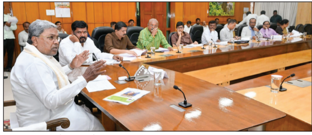
ಹಂಪಿ ಟೈಮ್ಸ್ ಬೆಂಗಳೂರು

ಮುಖ್ಯಮಂತ್ರಿ ಸಿದ್ದರಾಮಯ್ಯ ಅವರ ಅಧ್ಯಕ್ಷತೆಯಲ್ಲಿ ಸೋಮವಾರ ನಡೆದ ಕ್ರಾಂತಿವೀರ ಸಂಗೊಳ್ಳಿ ರಾಯಣ್ಣ ಕ್ಷೇತ್ರ ಅಭಿವೃದ್ಧಿ ಪ್ರಾಧಿಕಾರದ ನಾಲ್ಕನೇ ಸಭೆಯ ಮುಖ್ಯಾಂಶಗಳು... ಹಂಪಿ ಟೈಮ್ಸ್ ಬೆಂಗಳೂರು