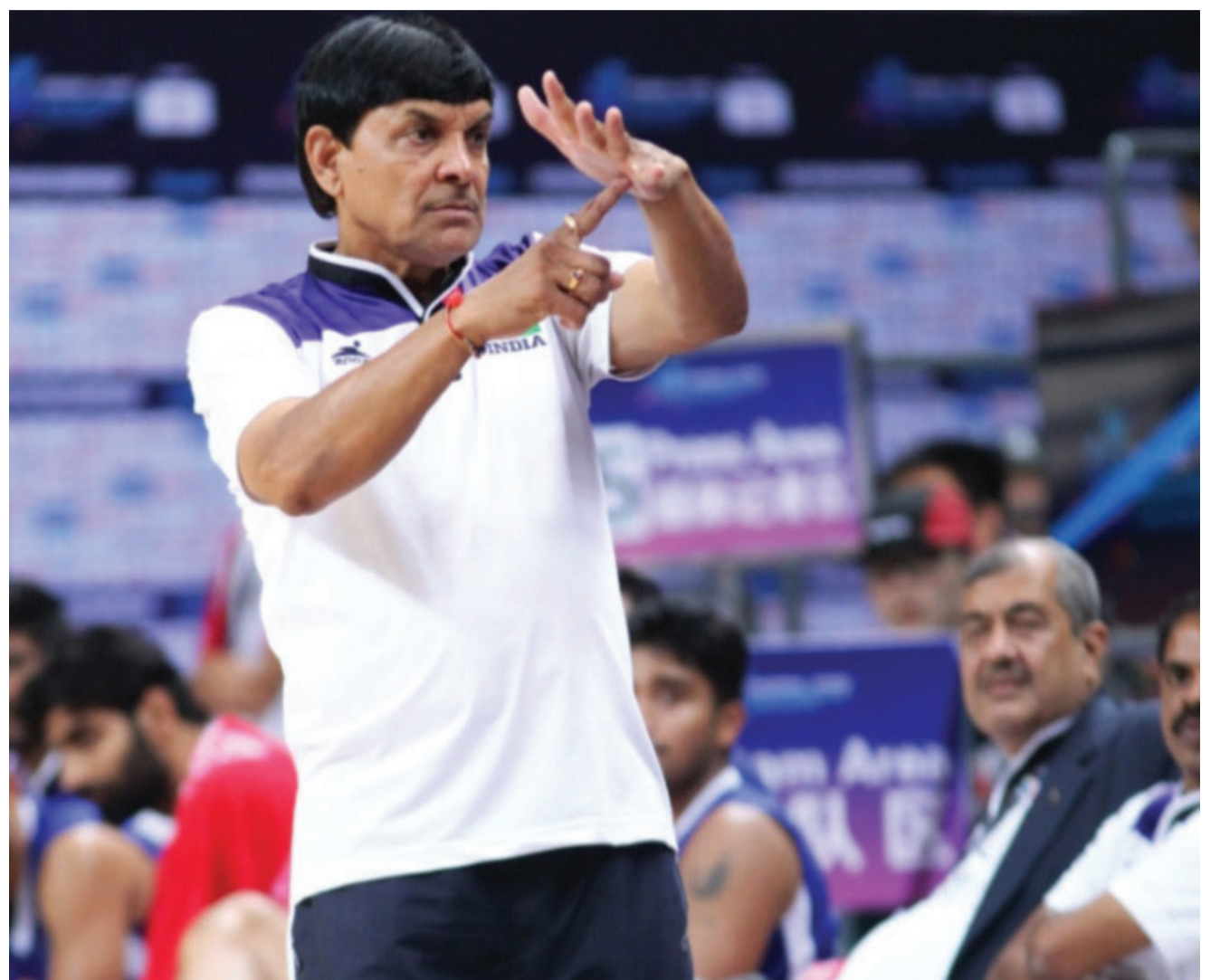
ಪ್ರತಿನಿಧಿಸಿದರು ಮತ್ತು ಚಿನ್ನದ ಪದಕ ಗೆಲ್ಲಲು ನೆರವಾದರು.

ಪ್ರತಿನಿಧಿಸಿದರು ಮತ್ತು ಚಿನ್ನದ ಪದಕ ಗೆಲ್ಲಲು ನೆರವಾದರು. ಬ್ಯಾಂಕಾಕ್‌ನಲ್ಲಿ ನಡೆದ ವಿ ಕೌನ್ ಪ್ರಿನ್ಸ್ ಕಪ್ ಬ್ಯಾಸ್ಕೆಟ್ ಬಾಲ್ ಚಾಂಪಿಯನ್‌ಶಿಪ್ 1987 ರಲ್ಲಿ ಭಾರತವನ್ನು ಪ್ರತಿನಿಧಿಸಿದರು. 1987 ರಲ್ಲಿ ದೆಹಲಿಯಲ್ಲಿ ನಡೆದ ವಿಶ್ವ ರೈಲ್ವೆ ಗೇಮ್ಸ್‌ನಲ್ಲಿ ಭಾರತೀಯ ರೈಲ್ವೆಸ್ ತಂಡದ ಕ್ಯಾಪ್ಟನ್ ಮತ್ತು ಕಂಚಿನ ಪದಕವನ್ನು ಗಳಿಸಿಕೊಟ್ಟರು. 1988 ಸಿರಿಯಾಕ್ಕೆ ಅಂತರರಾಷ್ಟ್ರೀಯ ಆಹ್ವಾನಿತ ಬ್ಯಾಸ್ಕೆಟ್ ಬಾಲ್ ಪ್ರವಾಸದಲ್ಲಿ ಭಾರತವನ್ನು ಪ್ರತಿನಿಧಿಸಿದ್ದಾರೆ. 1989 ಇರಾನ್‌ನ ಮಹಾದನ್‌ನಲ್ಲಿ ನಡೆದ ಅಂತರರಾಷ್ಟ್ರೀಯ ಆಹ್ವಾನಿತ ಬ್ಯಾಸ್ಕೆಟ್ ಬಾಲ್ ಪಂದ್ಯಾವಳಿಯಲ್ಲಿ ಭಾರತ ತಂಡವನ್ನು ಪ್ರತಿನಿಧಿಸಿದ್ದಾರೆ. 1990 ರಲ್ಲಿ ರೊಮೇನಿಯಾದಲ್ಲಿ ನಡೆದ ವಿಶ್ವ ರೈಲ್ವೆ ಗೇಮ್ಸ್‌ನಲ್ಲಿ ಭಾರತೀಯ ರೈಲ್ವೆ ತಂಡದಿಂದ ಪ್ರತಿನಿಧಿಸಿ ಕಂಚಿನ ಪದಕವನ್ನು ಗಳಿಸಿಕೊಟ್ಟರು. ತರಬೇತುದಾರರಾಗಿ ಸಾಧನೆಗಳು ಎಫ್.ಐ.ಬಿ.ಎ. ಏಷ್ಯಾ ಚಾಲೆಂಜರ್ ಕಪ್ 2016 ಹಿರಿಯ ಭಾರತೀಯ ಪುರುಷ ತಂಡವು 27 ವರ್ಷಗಳ ನಂತರ ಅರ್ಹತೆ ಮತ್ತು ಏಳನೇ ಸ್ಥಾನವನ್ನು ಪಡೆದುಕೊಂಡಿತು. 28 ನೇ ಎಫ್.ಐ.ಬಿ.ಎ.ಏಷ್ಯಾ ಬ್ಯಾಸ್ಕೆಟ್ ಬಾಲ್ ಚಾಂಪಿಯನ್‌ಶಿಪ್ 2015 ರ ಹಿರಿಯ ಭಾರತೀಯ ಬ್ಯಾಸ್ಕೆಟ್ ಬಾಲ್ ಪುರುಷರ ತಂಡವು 12 ವರ್ಷಗಳ ನಂತರ ಅರ್ಹತೆ ಗಳಿಸಿ ಕ್ವಾರ್ಟರ್‌ಫೈನಲ್‌ನಲ್ಲಿ ಪ್ರದರ್ಶನ ನೀಡಿತು.