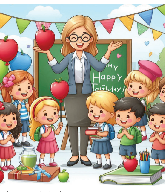
ಒಯ್ಯುವ ಸಾಧನ ವಾಗರ್. ಶಿಕ್ಷಕರು ಪಾಠಗಳನ್ನು ಯಾಂತ್ರಿಕವಾಗಿ ವಿದ್ಯಾರ್ಥಿಗಳಿಗೆ ತಲುಪಿಸುವುದಾದರೆ ನಮಗೂ ಗಣಕ ಯಂತ್ರಗಳಿಗೂ ಯಾವುದೇ ವ್ಯತ್ಯಾಸವಿರುವುದಿಲ್ಲ. ಪಠ್ಯದಾಚೆಗಿನ ವಿಶಾಲ ಬದುಕನ್ನು ಪ್ರೀತಿಯಿಂದ ಸ್ವೀಕರಿಸುವ, ಎಲ್ಲರೊಳಗೊಂದಾಗುವ ಮುಕ್ತ ಮನಸ್ಸನ್ನು ರೂಪಿಸುವಂತಾಗಬೇಕು. ಸೋತರೂ, ಎಡವಿದರೂ ಜೀವನವನ್ನು ಸಹ್ಯಗೊಳಿಸಿಕೊಳ್ಳುವ ಅಗಾಧ ಜೀವನೋತ್ಸಾಹವನ್ನು ಬಿತ್ತಿ ಬೆಳೆಯಬೇಕು. ಆಗ ಮಾತ್ರ ಶಿಕ್ಷಕರ ಸ್ಥಾನ ಶ್ರೇಷ್ಠತೆಯತ್ತ ಸಾಗಲು ಸಾಧ್ಯ.