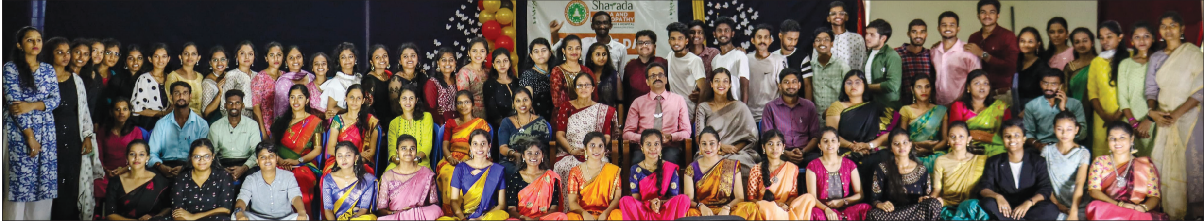
ಮಂಗಳೂರಿನ ಶಾರದಾ ಯೋಗ ಮತ್ತು ಪ್ರಕೃತಿ ಚಿಕಿತ್ಸೆ ವೈದ್ಯಕೀಯ ಕಾಲೇಜು ಗುರುಗಳೊಂದಿಗೆ ವಿದ್ಯಾರ್ಥಿಗಳ ಸಂಭ್ರಮದ ಸವಿ ಸವಿ ನೆನಪಿನ ಕ್ಷಣ