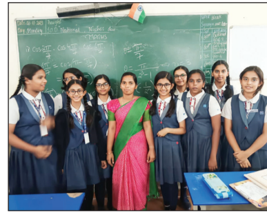
ಶ್ರೀ ಚೈತನ್ಯ ಟೆಕ್ನೋ ಸ್ಕೂಲ್, ಹೊಸಪೇಟೆ, ವಿಜಯನಗರ