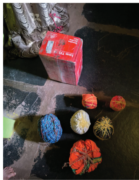
ಕಾರ್ಯ ಮುಂದುವರೆದ ಬೆನ್ನಲ್ಲಿ ಅದೇ ಊರಿನ