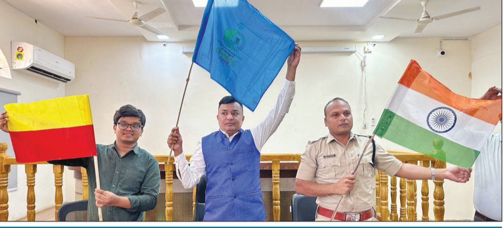
ಹಿಂಗಿದೆ ಸೆ.15ರ ಮಾನವ ಸರಪಳಿ ಕಾರ್ಯಕ್ರಮ ಪಟ್ಟಿ