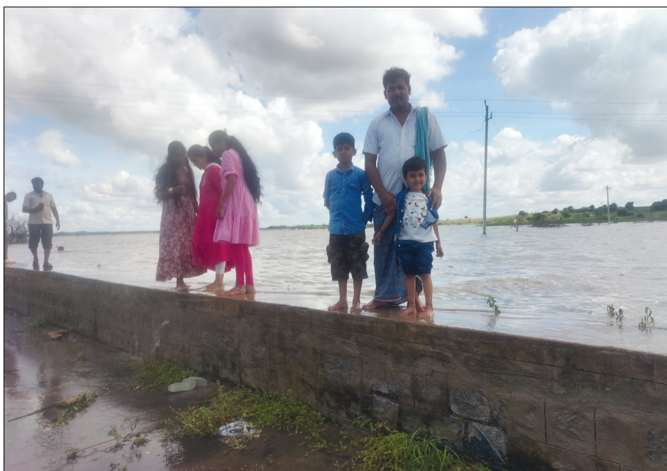
ಭತ್ತ ಇಲ್ಲದಂತಾಗಿ. ಅಂದಿಗೂ ಇಂದಿಗೂ ಇಲ್ಲಿನ ಗದ್ದೆಗಳಲ್ಲಿ ಭತ್ತದ ಫಸಲು ಮರೀಚಿಕೆ ಆಗಿದೆ. 33 ವರ್ಷಗಳಲ್ಲಿ ಕೆರೆ ಮಾತ್ರ 3-4 ಬಾರಿ ತುಂಬಿದೆ. ಅಂತರ್ಜಲ ನಿರ್ವಹಣೆಗಾಗಿ ಕೆರೆಯ ನೀರು ರೈತರಿಗೆ ಭತ್ತ ಬೆಳೆಯಲು ಪೂರೈಕೆ ಆಗದಂತಾಯಿತು. ಎಂದು ಭತ್ತ ಬೆಳೆಗಾರ ರೈತ ಪತ್ರಿಕೆಗೆ ಮಾಹಿತಿ ನೀಡಿದರು.

■ ಹಂಪಿ ಟೈಮ್ಸ್ ಕೊಟ್ಟೂರು ಕೊಟ್ಟೂರು ತಾಲೂಕಿನಾದ್ಯಂತ ಶುಕ್ರವಾರ ರಾತ್ರಿ ಉತ್ತಮವಾಗಿ ಸುರಿದ ಚಿತ್ರಮಳೆಗೆ, ಕೊಟ್ಟೂರು ಕೆರೆ ಶನಿವಾರ ಮಧ್ಯಾಹ್ನ ತುಂಬಿ ಹರಿದಿದೆ. ಕೆರೆಯ ಕೋಡಿ ಬಿದ್ದ ವಿಷಯ ತಿಳಿದ ಪಟ್ಟಣದ ಜನರು ತಂಡು ತಂಡಾಗಿ ಆಗಮಿಸಿ, ತುಂಬಿ ಹರಿಯುವ ಕೆರೆಯನ್ನು ವೀಕ್ಷಿಸಿ ಹರ್ಷ ವ್ಯಕ್ತಪಡಿಸಿದರು. 2022 ಇದೇ ಅಕ್ಟೋಬರ್ ತಿಂಗಳಲ್ಲಿ 10 ವರ್ಷಗಳ ನಂತರ ಕೆರೆ ತುಂಬಿತ್ತು. ಮತ್ತೆ 2 ವರ್ಷದ ನಂತರ ಇಂದು ವಿಜಯ ದಶಮಿ ದಿನದಂದು ಕೆರೆ ತುಂಬಿರುವುದು ಕೊಟ್ಟೂರು ಮತ್ತು ತಾಲೂಕಿನ ಜನರಲ್ಲಿ ಸಂಭ್ರಮ ಮನೆ ಮಾಡಿದೆ. ಕೊಟ್ಟೂರು ಕೆರೆ ಸುಮಾರು 930 ಎಕರೆಗೂ ಹೆಚ್ಚು ವಿಸ್ತೀರ್ಣ ಹೊಂದಿದ್ದು 850 ಎಕರೆಗೆ ಬೇಕಾಗುವಷ್ಟು ನೀರನ್ನು ಸಂಗ್ರಹಣ ಸಾಮರ್ಥ್ಯ ಹೊಂದಿದ ಬೃಹತ್ ಕೆರೆ. 1889 ರಲ್ಲಿ ಇದರ ನಿರ್ಮಾಣ. ಅಂದಿನಿಂದ ಕೆರೆ ಕೆಳ ಭಾಗದ ಕೊಟ್ಟೂರಿನ ಚಿರಿಬಿ ರಸ್ತೆ, ಕೂಡ್ಲಿಗಿ ರಸ್ತೆ ಹಾಗೂ ಹಗಲಿಬೊಮ್ಮನಹಳ್ಳಿ ರಸ್ತೆಯ ಮಾರ್ಗದಲ್ಲಿ ಎತ್ತ ನೋಡಿದರತ್ತ ಭತ್ತದ ಗದ್ದೆಗಳು ನೋಡುಗರ ಕಣ್ಣಿಗೆ ಸಂಭ್ರಮ ಉಂಟು ಮಾಡುತ್ತಿದ್ದವು. 1993 ರ ಸುಮಾರಿಗೆ ಕೆರೆ ಭಾಗಶಃ ತುಂಬುತ್ತಿತ್ತೆ ವಿನ್ಯಾಸ ಕೆರೆ ಸಂಪೂರ್ಣ ತುಂಬದ ಕಾರಣ ಗದ್ದೆಗಳಲ್ಲಿ