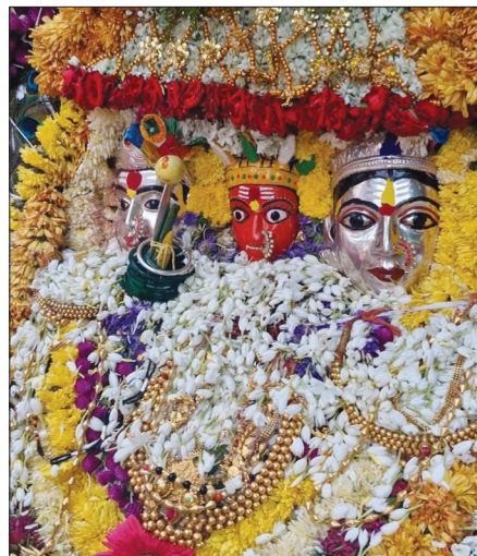
ಹೊಸಪೇಟೆಯ ತಳವಾರ ಕೇರಿ ರಾಂಪುರ ದುರುಗಮ್ಮ ದೇವಿಗೆ ವಿಶೇಷ ಪೂಜೆ ಸಲ್ಲಿಸಲಾಯಿತು.