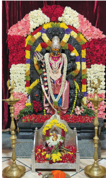
ಹೊಸಪೇಟೆಯ ಎಸ್ ಕೆ ಸಮಾಜದ ಅಂಬಾ ಭವಾನಿ ದೇವಸ್ಥಾನದಲ್ಲಿ ದೇವಿಗೆ ದಸರಾ ವಿಶೇಷ ಪೂಜೆ ನೆರವೇರಿಸಲಾಯಿತು