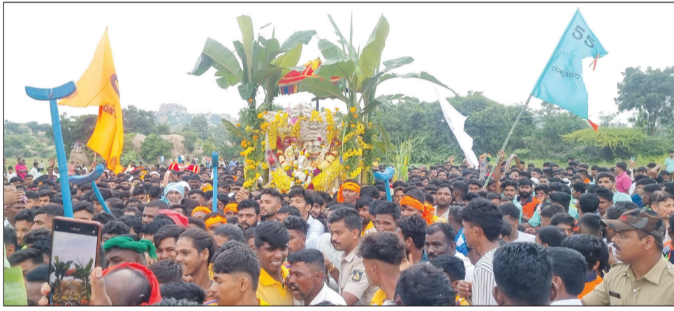
ಉದ್ದ ಜನ ದಟ್ಟಣೆಯಿಂದ ರಸ್ತೆ ತುಂಬಿತ್ತು. ಹಂಪಿ ಅಂಗಳದ ಧರ್ಮದಗುಡ್ಡದಲ್ಲಿ ದೇವರ ಬನ್ನಿಮುಡಿಯುವ ಕ್ಷಣಗಳನ್ನು ಕಣ್ತುಂಬಿಕೊಳ್ಳುವ ಸೌಭಾಗ್ಯ ಈ ಭಾಗದ ಭಕ್ತರು ತಮ್ಮದಾಗಿಸಿಕೊಂಡರು.

■ ಹಂಪಿ ಟೈಮ್ಸ್ ಹೊಸಪೇಟೆ ತಾಲೂಕಿನ ಬಸವನದುರ್ಗ ಚೆನ್ನಬಸವೇಶ್ವರಸ್ವಾಮಿ ಮತ್ತು ಹೊಸಪೇಟೆಯ ಏಳುಕೇರಿ ಸೇರಿದಂತೆ ತಾಲೂಕಿನ ವಿವಿಧ ಪ್ರದೇಶಗಳಿಂದ ಪಲ್ಲಕ್ಕಿಯಲ್ಲಿ ಆಗಮಿಸಿದ್ದ 20ಕ್ಕೂ ಅಧಿಕ ಶಕ್ತಿ ದೇವತೆಗಳ ಉತ್ಸವ ಮೂರ್ತಿಗಳು ಶುಕ್ರವಾರ ನಾಗೇನಹಳ್ಳಿ ಗ್ರಾಮಪಂಚಾಯತಿ ವ್ಯಾಪ್ತಿಯ ಗುಡಿ ಓಬಳಾಪುರದಲ್ಲಿರುವ ಧರ್ಮದಗುಡ್ಡದಲ್ಲಿ ಸಮ್ಮಿಲನಗೊಂಡು ಗುಡ್ಡದ ಶ್ರೀಚೆನ್ನಬಸವೇಶ್ವರಸ್ವಾಮಿಗೆ ಮತ್ತು ನಿಜಲಿಂಗಮ್ಮದೇವಿಗೆ ಪೂಜೆಸಲ್ಲಿಸಿ, ಬನ್ನಿ ವೃಕ್ಷಕ್ಕೆ ಪ್ರದಕ್ಷಿಣೆ ಹಾಕಿ ದೇವರ ಬನ್ನಿಮುಡಿದ ಕ್ಷಣಗಳನ್ನು ಸಾವಿರಾರು ಭಕ್ತರು ಕಣ್ತುಂಬಿಕೊಂಡರು. ಮಧ್ಯಾಹ್ನ 2 ಗಂಟೆಯಿಂದ ಸುರಿಯುತ್ತಿದ್ದ ಮಳೆಯಲ್ಲಿ ಹೊಸಪೇಟೆ ಏಳುಕೇರಿ ಮತ್ತು ಕಮಲಾಪುರ, ಕೊಂಡನಾಯಕನಹಳ್ಳಿ, ಚಿತ್ರವಾಡಿ, ನರಸಾಪುರ, ಬೆನಕಾಪುರ, ನಾಗೇನಹಳ್ಳಿ ಸೇರಿದಂತೆ ಇತರಡೆಗಳಿಂದ ಶಕ್ತಿ ದೇವತೆಗಳ ಪಲ್ಲಕ್ಕಿಯನ್ನು ಹೊತ್ತ ಭಕ್ತರು ಮಳೆಯನ್ನೂ ಲೆಕ್ಕಿಸದೆ ಧರ್ಮದ ಗುಡ್ಡದತ್ತ ಓಡುತ್ತ ಬಂದರು. ಪಲ್ಲಕ್ಕಿಗಳ ಹಿಂದೆ ಯುವಕರ ತಂಡಗಳು ಬಣ್ಣಬಣ್ಣದ ಟೀಶರ್ಟ್ ತೊಟ್ಟು ಹೆಜ್ಜೆಹಾಕಿದರು. ಪ್ರಯಾಣಿಕರು ಹೊತ್ತ ನೂರಾರು ವಾಹನಗಳು ಗುಡ್ಡದತ್ತ ಮುಖಮಾಡಿದ್ದವು. 2 ಕಿ.ಮೀಟರ್ಗೂ