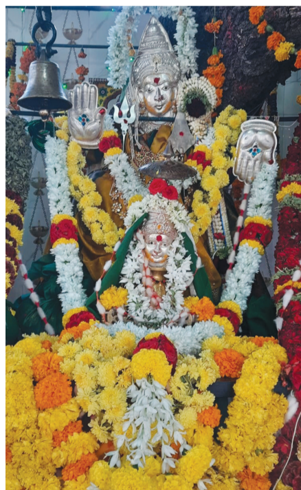
ಹೊಸಪೇಟೆ ತಾಲೂಕಿನ ಕಮಲಾಪುರದ ಕೋಟೆಯ ಬನ್ನಿಮಹಾಕಾಳಿ ದೇವಿ ಭಕ್ತರಿಂದ ಮೂಗಿನ ಜಡ ಯಿಂದ ಅಲಂಕೃತಗೊಂಡು ಪೂಜೆಗೊಂಡಳು