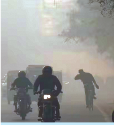
ಕಬ್ಬಿನ ತ್ಯಾಜ್ಯಕ್ಕೆ ಬೆಂಕಿಯ ಹಚ್ಚಿ ಓಡುವ ವಾಹನಗಳ ಹೊಗೆಯು ಹಚ್ಚಿ ಏರಿದ ದೆಹಲಿಯ ಮಾಲಿನ್ಯ