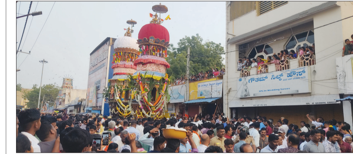
ಕಂಪ್ಲಿ ಪಟ್ಟಣದ ಆರಾಧ್ಯದೈವ ಶ್ರೀಪೇಟೆ ಬಸವೇಶ್ವರ ನೀಲಮ್ನನವರ ಚೋಡಿ ರಥೋತ್ಸವ ಮಂಗಳವಾರ ಶ್ರದ್ಧೆಭಕ್ತಗಳಿಂದ ಜರುಗಿತು.