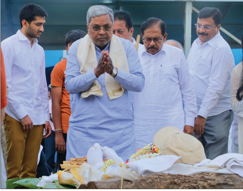
ಮುಖ್ಯಮಂತ್ರಿ ಸಿದ್ದರಾಮಯ್ಯ ಅವರು ಮಾಜಿ ಮುಖ್ಯಮಂತ್ರಿ ದಿವಂಗತ ಎಸ್.ಎಂ.ಕೃಷ್ಣ ಅವರ ಅಂತಿಮ ಸಂಸ್ಕಾರದಲ್ಲಿ ಪಾಲ್ಗೊಂಡು ಬುಧವಾರ ಅಂತಿಮ ನಮನ ಸಲ್ಲಿಸಿದರು.

■ ಹಂಪಿ ಟೈಮ್ಸ್ ಬೆಂಗಳೂರು : ಎಸ್.ಎಂ ಕೃಷ್ಣ ಅವರೊಬ್ಬ ದೂರದೃಷ್ಟಿವಳ್ಳ ಮುಕ್ತ ರಾಜಕಾರಣಿ. ಕರ್ನಾಟಕ ಮತ್ತು ದೇಶದ ರಾಜಕಾರಣದಲ್ಲಿ ದೀರ್ಘ ಕಾಲ ತಮ್ಮನ್ನು ತೊಡಗಿಸಿಕೊಂಡಿದ್ದರು ಎಂದು ಮುಖ್ಯಮಂತ್ರಿ ಸಿದ್ದರಾಮಯ್ಯ ತಿಳಿಸಿದರು. ಅವರು ಸದಾಶಿವನಗರದಲ್ಲಿರುವ ಮಾಜಿ ಮುಖ್ಯಮಂತ್ರಿ ಹಾಗೂ ಕೇಂದ್ರ ವಿದೇಶಾಂಗ ಸಚಿವರಾಗಿದ್ದ ಎಸ್.ಎಂ ಕೃಷ್ಣರವರ ಪಾರ್ಥಿವ ಶರೀರದ ಅಂತಿಮ ದರ್ಶನ ಪಡೆದು ಕುಟುಂಬದವರಿಗೆ ಸಾಂತ್ವನ ಹೇಳಿದ ನಂತರ ಮಾಧ್ಯಮ ದವರೊಂದಿಗೆ ಮಾತನಾಡಿದರು. ಬೆಂಗಳೂರನ್ನು ಸಿಂಗಾಪುರ ಮಾಡಬೇಕೆಂಬ ಕನಸು : ಸುಮಾರು ಆರು ದಶಕಗಳಿಗೂ ಹೆಚ್ಚು ಕಾಲ ಸಾರ್ವಜನಿಕ ಜೀವನದಲ್ಲಿದ್ದ ಅವರು, ಸಮರ್ಥ ಆಡಳಿತಗಾರರು. ವಿಧಾನಸಭೆ, ವಿಧಾನ ಪರಿಷತ್ತು, ಲೋಕಸಭೆ ರಾಜ್ಯಸಭೆಗಳಲ್ಲಿ ಸದಸ್ಯರಾಗಿದ್ದ ಕೆಲವೇ ರಾಜಕಾರಣಿಗಳಲ್ಲಿ ಇವರೂ ಒಬ್ಬರು. ಈ ರಾಜ್ಯದ ಮುಖ್ಯಮಂತ್ರಿ ಯಾಗಿದ್ದರು. ವಿಧಾನಸಭೆಯ ಅಧ್ಯಕ್ಷರೂ ಆಗಿದ್ದರು. ಐದು ವರ್ಷಗಳ ಕಾಲ ರಾಜ್ಯದ ಮುಖ್ಯಮಂತ್ರಿಯಾಗಿ ಬೆಂಗಳೂರನ್ನು ಸಿಂಗಾಪುರ ಮಾಡಬೇಕೆಂಬ ಕನಸು ಕಂಡಿದ್ದರು. ಅವರ ಕನಸು ನನಸಾಗಲಿಲ್ಲ. ನಾಲ್ಕುವರೆ ವರ್ಷಗಳ ಕಾಲ ಮುಖ್ಯಮಂತ್ರಿಯಾಗಿದ್ದ ಅವರಲ್ಲಿ ಐ. ಟಿ ಬೆಳವಣಿಗೆಗೆ ಅಪಾರ ಕೊಡುಗೆಯನ್ನು ಕೊಟ್ಟಿದ್ದಾರೆ. ಬೆಂಗಳೂರು ನಗರ ಅಂತರರಾಷ್ಟ್ರೀಯ ಮಟ್ಟದಲ್ಲಿ ಗುರುತಿಸಿ ಕೊಂಡಿದ್ದರೆ ಅದಕ್ಕೆ ಎಸ್.ಎಂ.ಕೃಷ್ಣ ಅವರು