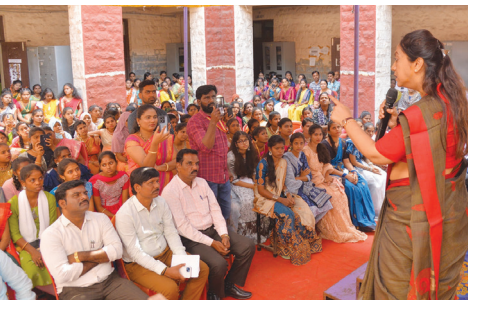
ರಾಜ್ಯ ಮಹಿಳಾ ಆಯೋಗದ ಅಧ್ಯಕ್ಷರು, ಕಾಲೇಜಿನಲ್ಲಿ 349 ವಿದ್ಯಾರ್ಥಿನಿಯರಿಗೆ ಕೇವಲ ಎರಡೇ ಶೌಚಾಲಯ ಸಾಕಾಗುವುದಿಲ್ಲ. ವಿದ್ಯಾರ್ಥಿನಿಯರ ಸಂಖ್ಯಾನುಗುಣವಾಗಿ ಇನ್ನೂ ಕೆಲವು ಶೌಚಾಲಯಗಳ ಅವಶ್ಯಕತೆ ಇದ್ದು,

ಉದ್ಘಾಟನೆ ಸಮಾರಂಭ ಹಾಗೂ ಬಿ.ಬಿ. ಬಿಕಾಂ ಪ್ರಥಮ ವರ್ಷದ ವಿದ್ಯಾರ್ಥಿನಿಯರಿಗೆ ಸ್ವಾಗತ ಕಾರ್ಯಕ್ರಮದಲ್ಲಿ ಭಾಗವಹಿಸಿ ಅವರು ಮಾತನಾಡಿದರು. ವಿದ್ಯಾರ್ಥಿನಿಯರು ಸಮಾಜದಲ್ಲಿ ಗುರುತಿಸಿಕೊಳ್ಳಲು ಗುಣಮಟ್ಟ ಶಿಕ್ಷಣ ಪಡೆದುಕೊಂಡು ವಿವಿಧ ಹೊಂದಬೇಕು. ಎಲ್ಲಾ ಕ್ಷೇತ್ರಗಳಲ್ಲಿ ಸಕ್ರಿಯವಾಗಿ ಭಾಗವಹಿಸುವುದರೊಂದಿಗೆ ಯಶಸ್ಸು ಕಾಣಬೇಕು ಎಂದರು. ತಂದೆ-ತಾಯಂದಿರು ಮಕ್ಕಳ ಉಜ್ವಲ ಭವಿಷ್ಯ ಕಾಣಲು ಕಾತುರದಿಂದ ಕಾಯುತ್ತಿರುತ್ತಾರೆ. ಹಾಗಾಗಿ ವಿದ್ಯಾರ್ಥಿಗಳು ಅವರ ಕನಸುಗಳನ್ನು ನನಸು ಮಾಡುವ ಆಶಾಭಾವನೆ ಹೊಂದಬೇಕು. ಸಮಾಜದಲ್ಲಿ ಉನ್ನತ ಸ್ಥಾನ ಹೊಂದಬೇಕು ಎಂದರು. ಕಾಲೇಜಿನ ಆವರಣದಲ್ಲಿ ಭೇಟಿ ನೀಡಿ ಪರಿಶೀಲಿಸಿದ