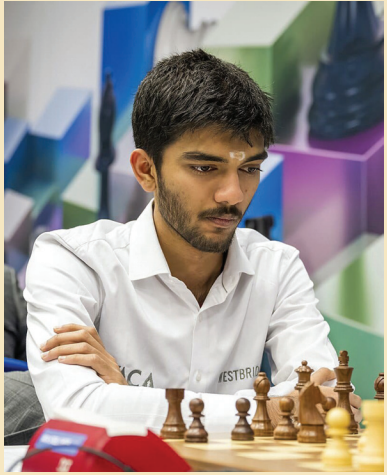
ಚದುರಂಗದಾಟದಲ್ಲಿ ಹದಗೊಂಡು ಚಾಕ್ರಿಯಲ್ಲಿ ಕದಲದಿಹ ಚಿತ್ರದಲ್ಲಿ ಸೇನುತಿದ್ದು ಎದುರಾಳಿ ಚೈನದವ ಮುದುಡಿದನು ನಿನ್ನೆದುರು ಮುದವಿತ್ತ ಭಾರತಕೆ ನೀನು ಗೆದ್ದು

ಕೆಲವಾರು ವರ್ಷಗಳ ಫಲಕಂಡು ಜಯ ದೊರೆತು ಫಲಿಸಿತದು ದೊರೆ ನೀನು ಚದುರಂಗಕೆ ತಲೆಯೆಲ್ಲ ಆಟದಲ್ಲಿ ಬಲವಂತ ಚಾಕ್ರಿಯಲ್ಲಿ ಒಲಿದಳೆದೊ ಜಯಲಕ್ಷಿ ನಿನ್ನಾಟಕೆ