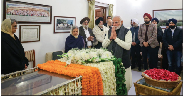
ಪ್ರಧಾನಿ ನರೇಂದ್ರ ಮೋದಿ ಅವರು ನಿಧನರಾದ ಡಾ. ಮನಮೋಹನ ಸಿಂಗ್ ಅವರಿಗೆ ಅಂತಿಮ ಪುಷ್ಪ ನಮನ ಸಲ್ಲಿಸಿದರು.