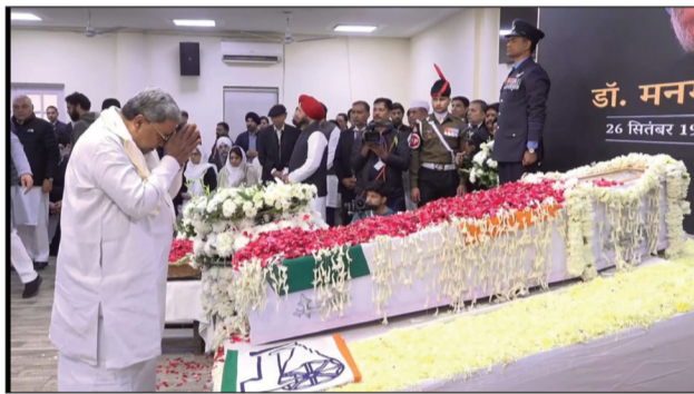
ಮುಖ್ಯಮಂತ್ರಿ ಸಿದ್ದರಾಮಯ್ಯ ಅವರು ನಿಧನರಾದ ಡಾ. ಮನಮೋಹನ ಸಿಂಗ್ ಅವರಿಗೆ ಅಂತಿಮ ಪುಷ್ಪ ನಮನ ಸಲ್ಲಿಸಿದರು.