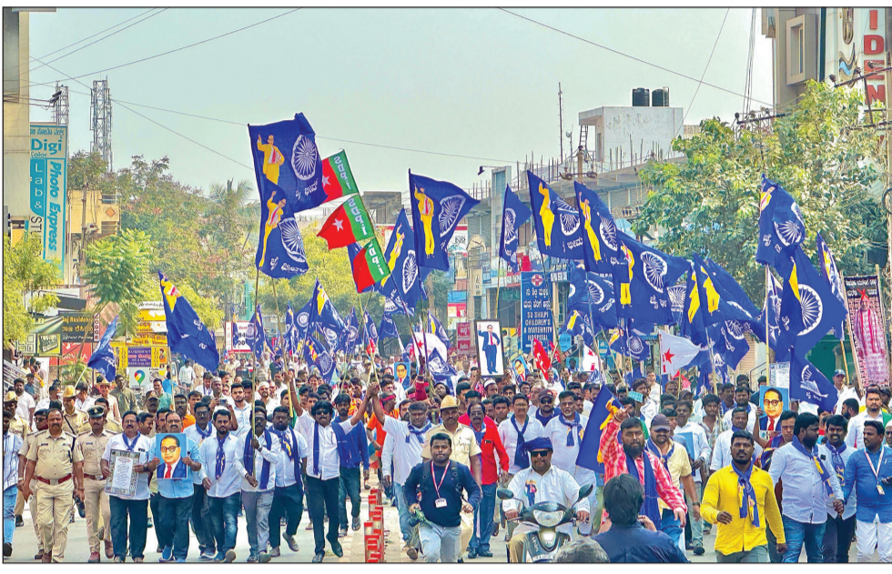
ಸಣ್ಣಪುಟ್ಟ ಚಹಾ ಅಂಗಡಿಗಳು ಬಂದ್ ಆಗಿದ್ದು, ನಡೆದವು. ಸಾರಿಗೆ ಸೌಲಭ್ಯವಿಲ್ಲದ್ದರಿಂದ ವಿದ್ಯಾರ್ಥಿಗಳು ನ್ಯಾಯಾಲಯದಲ್ಲಿ ಎಂದಿನಂತೆ ಕಾರ್ಯಲಾಪಗಳು ತಾಲಾ ಕಾಲೇಜುಗಳಿಗೆ ಗೈರಾಗಿದರು. ನಗರದ ರಸ್ತೆಗಳು

■ ಹಂಪಿ ಟೈಮ್ಸ್ ಹೊಸಪೇಟೆ ನಗರದ ಸಂವಿಧಾನ ಸಂರಕ್ಷಣಾ ಸಮಿತಿ ಸೇರಿದಂತೆ ವಿವಿಧ ಸಂಘಟನೆಗಳ ಬೆಂಬಲದೊಂದಿಗೆ ಕೆರೆ ನೀಡಿದ್ದ ವಿಜಯನಗರ ಬಂದ್‌ಗೆ ಜಿಲ್ಲಾಧ್ಯಕ್ಷ ಮಿಶ್ರಪ್ರತಿಕ್ರಿಯೆ ವ್ಯಕ್ತವಾಗಿದೆ. ಹೊಸಪೇಟೆ ನಗರದಲ್ಲಿ ಗುರುವಾರ ಬಹುತೇಕ ಅಂಗಡಿಗಳಿಗೆ ರಜೆ ದಿನವಾಗಿದ್ದರಿಂದ ಇನ್ನುಳಿದ ವ್ಯಾಪಾರಸ್ಥರು ತಮ್ಮ ಅಂಗಡಿ ಮುಂಗಟ್ಟುಗಳು ಮುಚ್ಚಿ ಪ್ರತಿಭಟನೆಗೆ ಬೆಂಬಲಿಸಿವೆ. ಹಾಗೇ ಕೂಡಗಿ, ಹ.ಬೊ.ಹಳ್ಳಿಯಲ್ಲೂ ಬಸ್‌ಗಳ ಸಂಚಾರ ಸ್ಥಗಿತಗೊಂಡಿದ್ದರಿಂದ ಪಟ್ಟಣದಿಂದ ಬೇರೆಡೆಗೆ ತೆರಳುವ ಪ್ರಯಾಣಿಕರು ಪರದಾಡಿದರು. ವೈಯಕ್ತಿಕ ವಾಹನಗಳು ಮತ್ತು ಆಟೋ ಹಾಗೂ ಕ್ಯೂಸರ್ ವಾಹನಗಳನ್ನು ಅವಲಂಬಿಸಿ ಊರುಗಳಿಗೆ ತೆರಳಿದ್ದು ಕಂಡುಬಂತು. ಬಸ್ ನಿಲ್ದಾಣಗಳು ಬಸ್ಸುಗಳಲ್ಲದೆ ಬಿಕೋ ಎನ್ನುತ್ತಿದ್ದರೆ, ತಾಲೂಕು ಕಾರ್ಯಾಲಯ ಸೇರಿದಂತೆ ಸರ್ಕಾರಿ ಕಚೇರಿಗಳಲ್ಲಿ ಸಿಬ್ಬಂದಿಗಳು ಕಚೇರಿಗಳಲ್ಲಿ ಹಾಜರಿದ್ದು, ಸಾರ್ವಜನಿಕರಿಗೆ ಸೇವೆ ನೀಡಲು ಎದುರು ನೋಡುವಂತಿತ್ತು. ಹೂ ವ್ಯಾಪಾರಸ್ಥರು ಹೂಗುಟ್ಟುಗಳನ್ನಿಟ್ಟುಕೊಂಡು ಗ್ರಾಹಕರಿಗಾಗಿ ಕಾಯುತ್ತಿದ್ದರು. ನಗರದ ಮುಖ್ಯ ರಸ್ತೆಗಳಲ್ಲಿದ್ದ