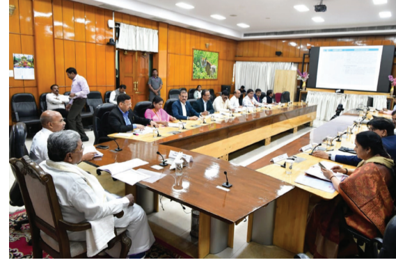
ರೂ.4331 ಕೋಟಿ ಅನುದಾನ ಹಂಚಿಕೆ ಮಾಡಲಾಗಿದ್ದು, ಇದುವರೆಗೆ ರೂ.3099 ಕೋಟಿ ಅನುದಾನ ಬಿಡುಗಡೆಯಾಗಿದೆ. ಇದರಲ್ಲಿ ರೂ.3005 ಕೋಟಿ ವೆಚ್ಚ ಮಾಡಲಾಗಿದ್ದು, ಬಿಡುಗಡೆ ಮೊತ್ತಕ್ಕೆ ಶೇ. 96.97 ಪ್ರಗತಿ ಸಾಧಿಸಲಾಗಿದೆ ಎಂದು ಸಚಿವರು ವಿವರಿಸಿದರು.

ಹಂಪಿ ಟೈಮ್ಸ್ ಬೆಂಗಳೂರು: ರಾಜೀವ್ ಗಾಂಧಿ ವೈದ್ಯಕೀಯ ವಿವಿಯಲ್ಲಿ ಹೆಚ್ಚುವರಿಯಾಗಿ ಸಂಗ್ರಹವಾಗಿರುವ ಮೊತ್ತವನ್ನು ಸರ್ಕಾರಿ ವೈದ್ಯಕೀಯ ಕಾಲೇಜುಗಳ ಮೂಲಸೌಲಭ್ಯಗಳಿಗಾಗಿ ಒದಗಿಸಲು ಮತ್ತು ನಿಮ್ಮನ್ನಲ್ಲಿ ಕರ್ನಾಟಕ ಆಡಳಿತ ಸೇವೆಯ ಅಧಿಕಾರಿಯ ನೇಮಕಾತಿಗೆ ಕ್ರಮ ಕೈಗೊಳ್ಳಲು ವೈದ್ಯಕೀಯ ಶಿಕ್ಷಣ ಸಚಿವ ಶರಣಪ್ರಕಾಶ್ ಪಾಟೀಲ್ ಅವರಿಗೆ ಮುಖ್ಯಮಂತ್ರಿ ಸಿದ್ದರಾಮಯ್ಯ ಅವರು ಸೂಚನೆ ನೀಡಿದರು. ಕೃಷ್ಣಾದಲ್ಲಿ ನಡೆದ ವೈದ್ಯಕೀಯ ಶಿಕ್ಷಣ ಇಲಾಖೆಯ ಪ್ರಗತಿ ಪರಿಶೀಲನೆ ಸಭೆಯಲ್ಲಿ ಈ ಸೂಚನೆ ನೀಡಿದರು. ಪ್ರಸ್ತುತ ಸಾಲಿನಲ್ಲಿ ವೈದ್ಯಕೀಯ ಕಾಲೇಜುಗಳ ನಿರ್ಮಾಣ ಮತ್ತು ಉಪಕರಣಗಳ ಖರೀದಿಗೆ ರೂ.400 ಕೋಟಿ ಹಾಗೂ ಸೂಪರ್ ಸ್ಪೆಷಾಲಿಟಿ ಆಸ್ಪತ್ರೆಗಳ ನಿರ್ಮಾಣಕ್ಕಾಗಿ ರೂ.130 ಕೋಟಿ ಅನುದಾನ ಒದಗಿಸಲಾಗಿದೆ. ಈ ಕಾಮಗಾರಿಗಳನ್ನು ಆದಷ್ಟು ಬೇಗನೆ ಪೂರ್ಣಗೊಳಿಸಲು ಸೂಚಿಸಿದರು. 2024-25 ನೇ ಸಾಲಿನಲ್ಲಿ ವೈದ್ಯಕೀಯ ಶಿಕ್ಷಣ ಇಲಾಖೆಗೆ