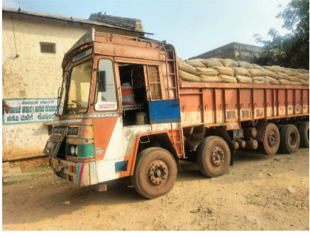
ಯಶಾ ರೀತಿ ವಾಪಸ್ಸು ಕಳುಹಿಸಿದರು.

■ ಹಂಪಿ ಟೈಮ್ಸ್ ಕೊಟ್ಟೂರು ಪಡಿತರ ಅಂಗಡಿಗಳಿಗೆ ವಿತರಿಸಲು 2 ಲಾರಿಗಳಲ್ಲಿ ಬಂದಿದ್ದ ಗುಣಮಟ್ಟ ಇಲ್ಲದ ಜೋಳವನ್ನು ಇಲ್ಲಿನ ಆಹಾರ ನಿರೀಕ್ಷರಾದ ಕಮಲಮ್ಮ ಗುಡ್ಡಪ್ಪರ ಶುಕ್ರವಾರ ವಾಪಸ್ಸು ಕಳುಹಿಸಿದ್ದಾರೆ. ಬಚ್ಚಾರಿಯ ಕರ್ನಾಟಕ ಆಹಾರ ನಿಗಮದಿಂದ ಜನವರಿ ತಿಂಗಳಲ್ಲಿ ಪಡಿತರ ಅಂಗಡಿಗಳಿಗೆ ವಿತರಿಸಲು ಕೊಟ್ಟೂರು ಎಸಿಎಂಸಿ ಆವರಣ ದೊಳಗಿರುವ ಪಡಿತರ ಆಹಾರ ಸಬರಾಜು ಘಟಕಕ್ಕೆ 2 ಲಾರಿಗಳಲ್ಲಿ ಬಂದಿದ್ದ 1120 ಚೀಲಗಳ ಮೇಲೆ ಹುಳುಗಳು ಓಡಾಡುತ್ತಿರುವುದನ್ನು ಅವಲೋಕಿಸಿದ ಆಹಾರ ನಿರೀಕ್ಷಕರು.