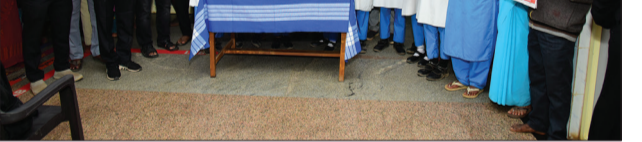
ಹೊಸಸೇವೆ ಸರ್ಕಾರಿ ತಾಯಿಮಕ್ಕಳ ಆಸ್ಪತ್ರೆಯಲ್ಲಿ ಹೆಣ್ಣು ಮಕ್ಕಳ ದಿನಾಚರಣೆ ಸಂಭ್ರಮ

ಹೆಣ್ಣು ಮಕ್ಕಳು ಹಲವು ಕೆಲಸಗಳನ್ನು ಒಟ್ಟಿಗೆ ನಿಭಾಯಿಸಬಲ್ಲವು ಸಾಮರ್ಥ್ಯ ಉಳ್ಳವರು. ಮನೆ ಮತ್ತು ಕಚೇರಿಯಲ್ಲೂ ದಕ್ಷವಾಗಿ ತಮ್ಮ ಹುದ್ದೆಗಳನ್ನು ನಿಭಾಯಿಸಬಲ್ಲರಾಗಿರುತ್ತಾರೆ. ಅವರು ಮುಕ್ತವಾಗಿ ಸಲಹೆ ನೀಡುವ ದೌರ್ಜನ್ಯದ ವಿರುದ್ಧ ಧ್ವನಿ ಎತ್ತುವ ವಾತಾವರಣ ಕಚೇರಿಗಳಲ್ಲೂ ಸೃಷ್ಟಿಯಾಗಬೇಕು. ಈಗಂತೂ ಹೆಣ್ಣು ಮಕ್ಕಳು ಎಲ್ಲ ರಂಗದಲ್ಲೂ ತನ್ನ ಭಾವವನ್ನು ಉರುವಲ್ಲಿ ಯಶಸ್ವಿಯಾಗಿದ್ದಾರೆ. ರಾಜಕೀಯ ರಂಗದಿಂದ ಹಿಡಿದು ಐಟಿ ಕಂಪನಿಗಳ ಸಿಬ್ಬಂದಿಗಳಾಗಿ ಗಗನಯಾನವನ್ನು ನಿಭಾಯಿಸುವ ವಿಜ್ಞಾನಿಗಳಾಗಿಯೂ ಕ್ಷೇತ್ರದಲ್ಲೂ ಗಂಡಿಗೆ ಸರಿಸಮನಾಗಿ ಸಾಧಿಸುತ್ತಿದ್ದಾರೆ. ಆದರೆ ಪೂರಕ ವಾತಾವರಣವಿಲ್ಲದೆ ಅವರ ಒತ್ತಡ ಹೆಚ್ಚಾದಾಗ ಅವರ ಯೋಗದಾನಕ್ಕೆ ಸವಾಲಾಗುತ್ತದೆ. ಈ ಒತ್ತಡ ಪರಿಸ್ಥಿತಿ ತರುವ ದೇವಿ ಮನಸಿಕ ಹಿಂಸೆ ಮುಂತಾದ ಪರಿಣಾಮಗಳನ್ನು ಅನುಭವಿಸಿ ಹೇಳಲು ಆಗದ ಬಿಡಲು ಆಗದ ಪರಿಸ್ಥಿತಿಯ ಸವಾಲು ಬಹಳ ಹೆಣ್ಣು ಮಕ್ಕಳಿಗೆ ಇದೆ. ಒಟ್ಟಾರೆ ತಮ್ಮ ಸುರಕ್ಷತೆ ಮಾನಸಿಕ ಭದ್ರತೆ ತಾರತಮ್ಯಗಳ ನಿವಾರಣೆ ಹತ್ತಿರದವರ ಪ್ರೀತಿಸಹಕಾರ ಹಾಗೂ ತಮ್ಮ ಸಾಮರ್ಥ್ಯ ಹಾಗೂ ಯೋಗದಾನ ಸಲ್ಲಿಸಿದಾಗ ಒಂದೊಂದು ಮಾತುಗಳು ಪ್ರೋತ್ಸಾಹಗಳಾಗಿ ಆಕೆಯ ಮನೋಸ್ಥೆಯನ್ನು ಹೆಚ್ಚಿಸುತ್ತವೆ. ಎಲ್ಲಾ ಸವಾಲುಗಳನ್ನು ಮೆಟ್ಟಿ ನಿಲ್ಲುವ ಮನೋಸ್ಥೆಯೇ ಹೆಚ್ಚಾಗುತ್ತದೆ. ಹೆಣ್ಣುಮಕ್ಕಳು ಎಲ್ಲರಂಗದಲ್ಲೂ ಮುಂದೆ ಬರುತ್ತಿರುವುದರಿಂದಲೇ ದೇಶದ ಪ್ರಗತಿ ಸಾಧ್ಯವಾಗುತ್ತದೆ. ಮೊನ್ನೆ ನಡೆದ 75 ಗಣರಾಜ್ಯೋತ್ಸವದ ಪೇರೇಡ್ ನಲ್ಲಿ ಸೈನ್ಯದ ಮೂರು ವಿಭಾಗಗಳಿಂದ ಹೆಣ್ಣು ಮಕ್ಕಳೇ ಭಾಗವಹಿಸಿ ಹಲವಾರು ಆಕರ್ಷಕ ಕೀರ್ತಿಯುಳ್ಳ ಮೆರವು ಪೇರೇಡಿಗೆ ರಂಗು ತಂದಿದ್ದರು. ಇತಿಹಾಸದಿಂದಲೂ ಹೆಣ್ಣು ಮಕ್ಕಳ ಪಾತ್ರ ಎಲ್ಲಾ ರಂಗದ ಪ್ರಗತಿಯಲ್ಲಿ ನಿರ್ಣಾಯಕವೆನಿಸಿದೆ. ಈ ನಿರ್ಣಾಯಕ ಪಾತ್ರಧಾರಿಗಳ ಸುಭದ್ರತೆಗೆ ಹಾಗೂ ಅವರ ಇನ್ನೂ ಹೆಚ್ಚು ಯೋಗದಾನ ಸಲ್ಲಿಸುವಂತಹ ವಾತಾವರಣ ಸೃಷ್ಟಿಸುವ ಕರ್ತವ್ಯದ ನಿಲುವು ಸಮಾಜದ್ದಾಗಲಿ.