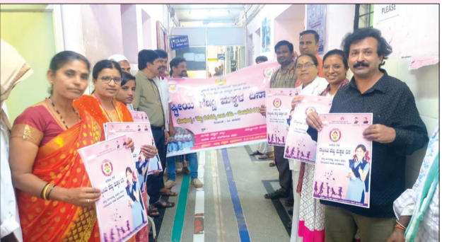
ಹರಪನಹಳ್ಳಿ ಸರ್ಕಾರಿ ಆಸ್ಪತ್ರೆಯಲ್ಲಿ ಹೆಣ್ಣು ಮಕ್ಕಳ ದಿನಾಚರಣೆ ಆಚರಿಸಿದರು.