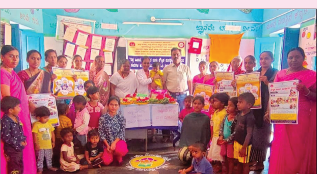
ಹಂಪಿನಗರ ಸರ್ಕಾರಿ ಆಸ್ಪತ್ರೆಯಲ್ಲಿ ಹೆಣ್ಣು ಮಕ್ಕಳ ದಿನಾಚರಣೆ ಆಚರಿಸಲಾಯಿತು.

ಹತ್ತಿರದವರ ಪ್ರೀತಿಸಹಕಾರ ಹಾಗೂ ತಮ್ಮ ಸಾಮರ್ಥ್ಯ ಹಾಗೂ ಯೋಗದಾನ ಸಲ್ಲಿಸಿದಾಗ ಒಂದೊಂದು ಮಾತುಗಳು ಪ್ರೋತ್ಸಾಹಗಳಾಗಿ ಆಕೆಯ ಮನೋಸ್ಥೆಯನ್ನು ಹೆಚ್ಚಿಸುತ್ತವೆ. ಎಲ್ಲಾ ಸವಾಲುಗಳನ್ನು ಮೆಟ್ಟಿ ನಿಲ್ಲುವ ಮನೋಸ್ಥೆಯೇ ಹೆಚ್ಚಾಗುತ್ತದೆ. ಹೆಣ್ಣುಮಕ್ಕಳು ಎಲ್ಲರಂಗದಲ್ಲೂ ಮುಂದೆ ಬರುತ್ತಿರುವುದರಿಂದಲೇ ದೇಶದ ಪ್ರಗತಿ ಸಾಧ್ಯವಾಗುತ್ತದೆ. ಮೊನ್ನೆ ನಡೆದ 75 ಗಣರಾಜ್ಯೋತ್ಸವದ ಪೇರೇಡ್ ನಲ್ಲಿ ಸೈನ್ಯದ ಮೂರು ವಿಭಾಗಗಳಿಂದ ಹೆಣ್ಣು ಮಕ್ಕಳೇ ಭಾಗವಹಿಸಿ ಹಲವಾರು ಆಕರ್ಷಕ ಕೀರ್ತಿಯುಳ್ಳ ಮೆರವು ಪೇರೇಡಿಗೆ ರಂಗು ತಂದಿದ್ದರು. ಇತಿಹಾಸದಿಂದಲೂ ಹೆಣ್ಣು ಮಕ್ಕಳ ಪಾತ್ರ ಎಲ್ಲಾ ರಂಗದ ಪ್ರಗತಿಯಲ್ಲಿ ನಿರ್ಣಾಯಕವೆನಿಸಿದೆ. ಈ ನಿರ್ಣಾಯಕ ಪಾತ್ರಧಾರಿಗಳ ಸುಭದ್ರತೆಗೆ ಹಾಗೂ ಅವರ ಇನ್ನೂ ಹೆಚ್ಚು ಯೋಗದಾನ ಸಲ್ಲಿಸುವಂತಹ ವಾತಾವರಣ ಸೃಷ್ಟಿಸುವ ಕರ್ತವ್ಯದ ನಿಲುವು ಸಮಾಜದ್ದಾಗಲಿ.