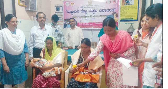
ಹೂವಿನ ಹದಗೆ ಸರ್ಕಾರಿ ಆಸ್ಪತ್ರೆಯಲ್ಲಿ ಹೆಣ್ಣು ಮಕ್ಕಳ ದಿನಾಚರಣೆ ಆಚರಿಸಿದರು.