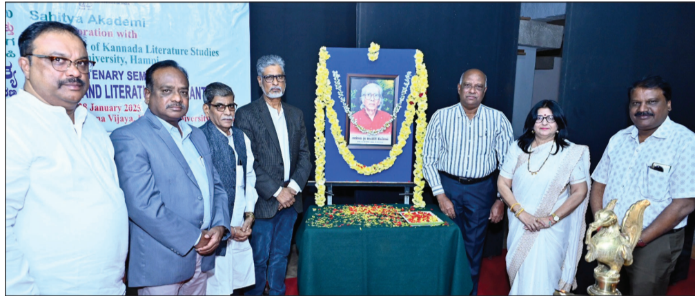
ಹಂಪಿ ಟೈಮ್ಸ್ ಹೊಸಪೇಟೆ