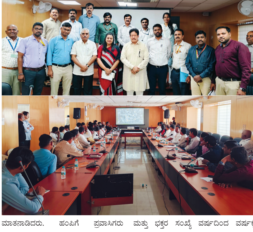
ಮಾತನಾಡಿದರು. ಹಂಪಿಗೆ ಪ್ರವಾಸಿಗರು ಮತ್ತು ಭಕ್ತರ ಸಂಖ್ಯೆ ವರ್ಷದಿಂದ ವರ್ಷಕ್ಕೆ